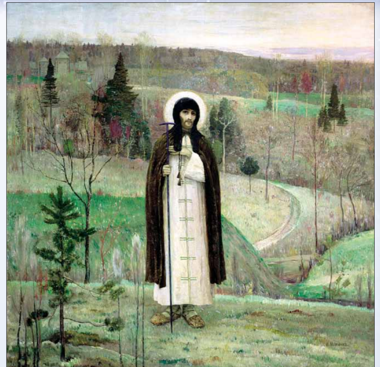
М.В. Нестеров. Преподобный Сергий Радонежский. 1899

Вопросы о смысле жизни и мироздания, о мировой справедливости находились в центре внимания русских философов Серебряного века, и подход к их решению связан с особенностями формирования культурного поля России. Завет Преподобного Сергия Радонежского: «Взирая на единство Святой Троицы, побеждать ненавистную рознь мира сего» – и его конкретное воплощение, создание Великим Святым общинности на Руси, стали