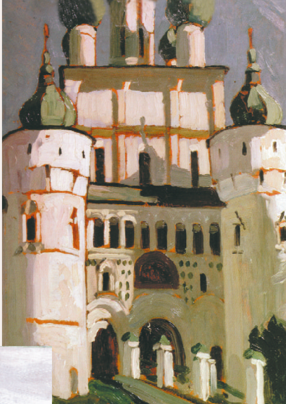
Н.К. Рерих. Ростов Великий. Вход в Кремль. 1903