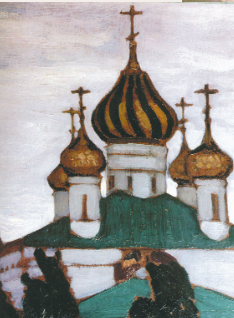
Н.К. Рерих. Ярославль. Церковь Св. Власия. 1903