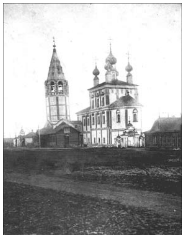
Село Шекшово. Фото начало XX века

думают поновлять свою церковь, и внутренность ее уже переписывается невероятными картинами в духе Доре. И нет мощного голоса, чтобы сказать им, какую несообразность они творят.