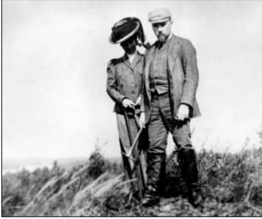
Н.К. и Е.И. Перихи. 1903-1904 гг.

березками и кустарником. Величавые, полные романтического блеска соборы задавлены ужасными домишками. Седые иконостасы обезображены нехудожественными доброхотными приношениями. Все потеряло свою жизненность. И стоят памятники, окруженные врагами снаружи и внутри. <...>