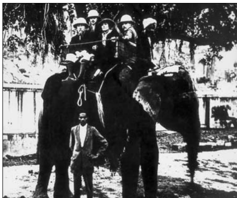
Семья Рерихов в Индии. Амбер (пригород Джайпура). 5-9 декабря 1923 г.

интересовал ряд проблем, связанных с мировыми миграциями древних народов и поиском общего источника славянской и индийской культур. Помимо чисто научных целей, экспедиция несла важную эволюционную задачу. Сложнейший маршрут экспедиции проходил через Сикким, Кашмир, Ладак, Китай (Синцзян), Россию (с заездом в Москву), Сибирь, Алтай, Монголию, Тибет, по неизученным областям Трансгималаев. Значение и результаты этой уникальной экспедиции до сих пор по достоинству не оценены современной географической наукой. А между тем, осуществив мечту Пржевальского и Козлова, экспедиция Николая Константиновича Рериха явилась триумфом русских исследований Центральной Азии. По уникальности маршрута и собранным материалам она по праву может претендовать на особое место среди крупнейших экспедиций XX века. Путешествие продолжалось с марта 1925 по май 1928 года. Впервые были отмечены на картах десятки новых горных вершин и перевалов, открыты археологические памятники, найдены редчайшие манускрипты. Был собран огромный научный материал, написаны книги («Сердце Азии», «Алтай – Гималаи»), создано около пятисот картин, на которых художник увековечил мир особенный и удивительный, мир высокой красоты.