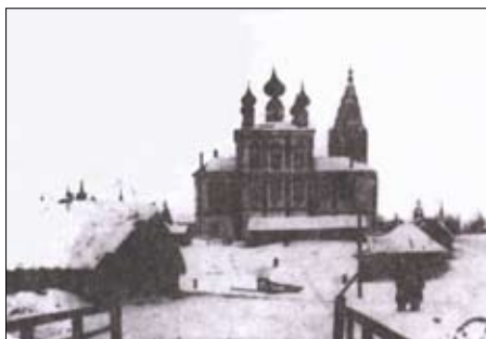
Село Шекиово. Фото начало XX века

Не обнаружив «старины» в Торках, Николай Константинович и его жена, Елена Ивановна, направились в Шекшово.