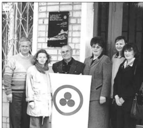
На открытии памятной доски в с. Шекиово 22 июня 2003 г.

В программе чтений прозвучали сообщения, рассказывающие о богатстве культурного наследия Гаврилово-Посадского края и современном состоянии памятников культуры, об экспедиции Н.К.Рериха по древним городам и влиянии этого путешествия на художественное и литературное творчество великого художника, а