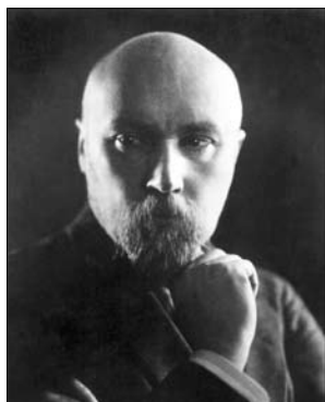
Н.К. Рерих. Чикаго. 1921 г.