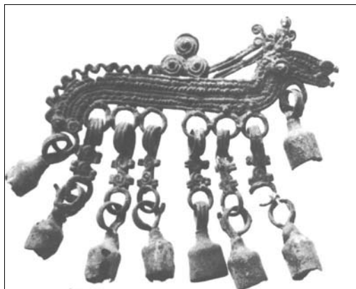
Шумящая подвеска. с.Шекшиово. Находка графа А.С.Уварова. 1852 г.

уже узнало светлую и темную магию знака – магию линии. Большинство старинных орнаментов носят в себе следы благих линий. И потому источник этих наслоений часто очень благостен. Теперь человечество овладеет мощностью цвета. И потому вопрос костюма и обихода, помимо красоты внешней, заключает в себе великое значение внутреннее» 1 .