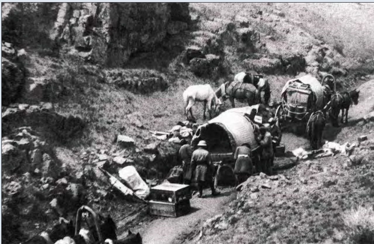
Караван Центрально-Азиатской экспедиции Н.К. Рериха. Алтай, 1926