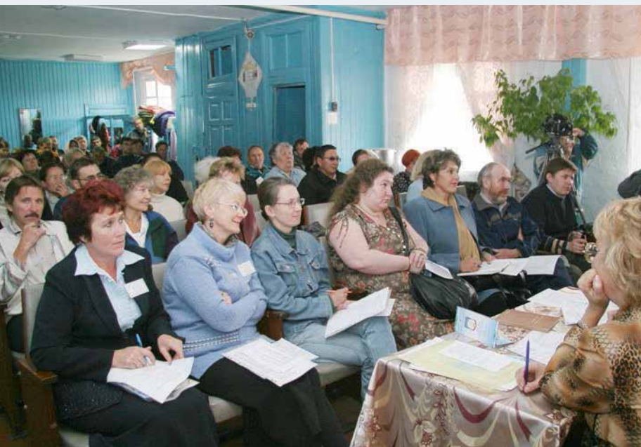
Научно-практическая конференция, посвященная 80-летию пребывания Центрально-Азиатской экспедиции Н.К. Рериха в селе Верх-Уймон. 9 августа 2006 г.