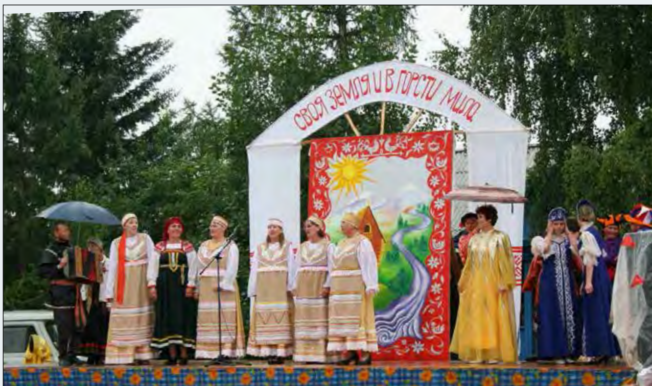
Выступают самодеятельные коллективы села Верх-Уймон

лось упоминание о том, что их посетили члены этой экспедиции. Но имена гостей не упоминаются. Чорос-Гуркин к тому времени был уже под пристальным наблюдением спецслужб, и докладчик предположила, что, если даже алтайский художник был с визитом у Рерихов, они его сознательно не упомянули в своих дневниках, чтобы не навредить.