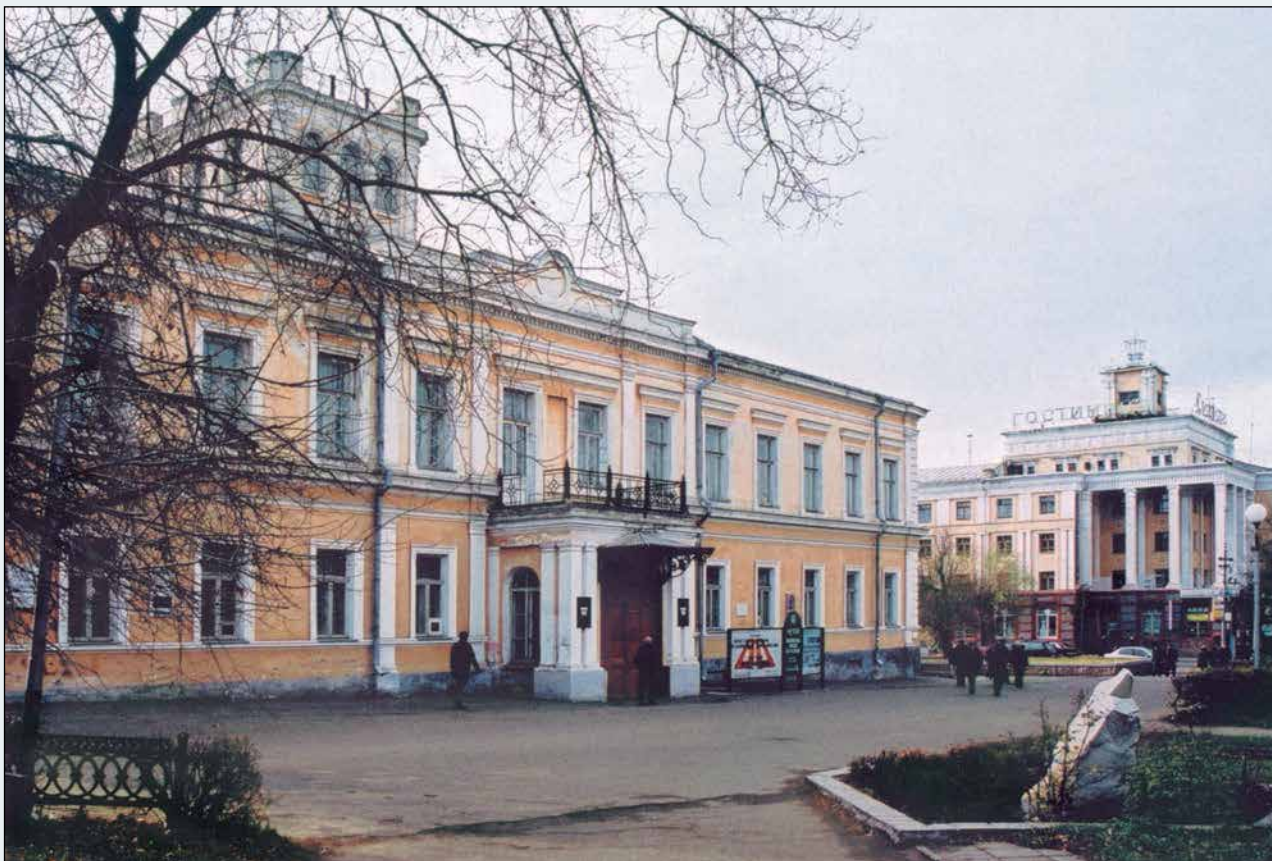
Областной музей изобразительных искусств им. М.А. Врубеля. Омск