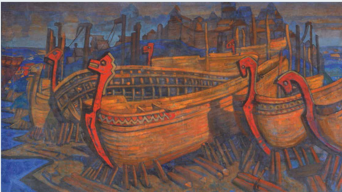
Н.К. Рерих. Ладьи. Город строят. 1903