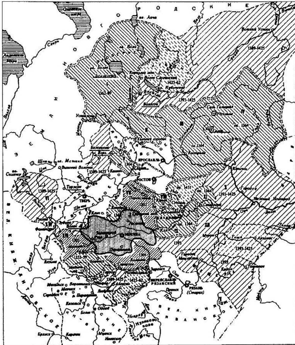
Рост Московского княжества и объединение русских земель в 1300—1462 гг.