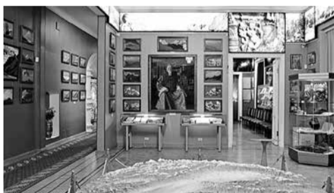
Зал Центрально-Азиатской экспедиции в общественном музее МЦР

Но в апреле 2017 года по инициативе Министерства культуры Государственный музей Востока