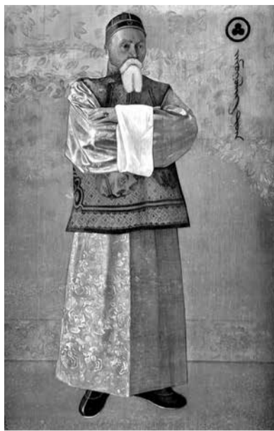
С.Н. Рерих. Портрет Н.К. Рериха, 1933 г.

5 февраля 1935 г., Пекин. Н.К. Рерих. Берегите старину. М.: МЦР, 1993 г.