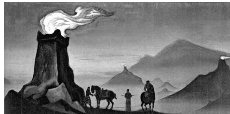
Н.К. Рерих. Огни победы, 1941 г.

В «Махабхарате», как вы помните, битва между родом, который