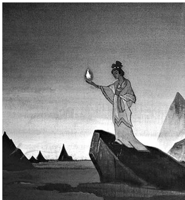
Н.К. Рерих. Агни Йога. Диптих, 1928

Без основ Живой Этики, без художественного творчества, без благородного женского начала человек придет в одичание. Если Вам скажут, что все эти принципы не новы, то скажите, что новизна их заключается в том, что по сие время все они оставались в небрежении. Нравственная сторона жизни в падении ее довела человечество до Армагеддона. Пренебрежение к творчеству наполнило жизнь безобразием. Пренебрежение к вопросам женского начала составило позор нашей эпохи. Говорят, что женское равноправие осуществлено. Но так ли это? Укажут на существование музеев и школ, но обычный обиход остается убогим и безобразным. Говорят, что в храмах утверждаются нравственные основы, но тогда почему мир стонет от множества преступлений? Все это означает лишь одно, а именно, что недостаточно сделано и достигнуто во всех указанных направлениях. Запущены многие пашни, опять с тем же плугом и с теми же зёрнами добрыми хлебопашцы духа должны прийти на пренебреженные поля и неустанным трудом оживить их. Много произнесено хороших слов, но, если они будут оставаться лишь в пределах звука, они еще не перейдут в действие. Люди плачут в храмах, люди восторгаются