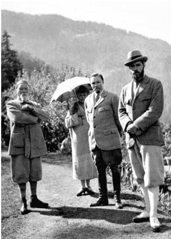
Семья Рерихов в Кулу, не позднее 1947 года