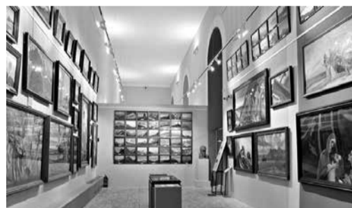
Экспозиция на ВДНХ

Однако сюжет видеорепортажа лихо уводит зрителей от правдивого ответа и «все стрелки» пере-