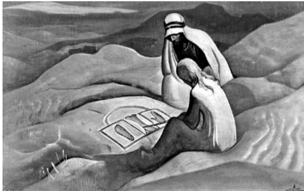
Н.К. Рерих. Знаки Христа. 1924 г.

Международный Совет Рериховских организаций имени С.Н. Рериха 11.09.2017