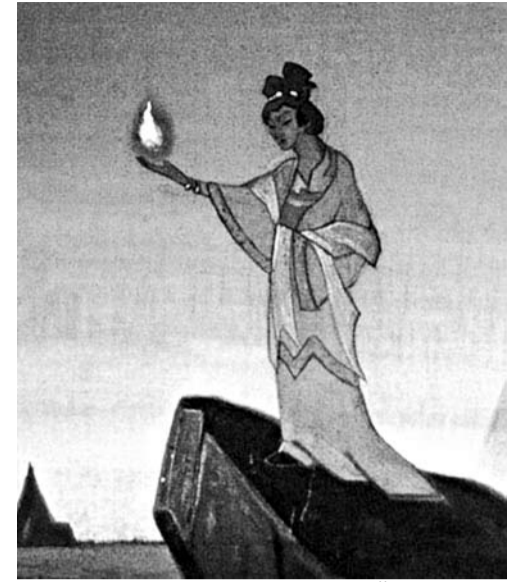
Н.К. Рерих. Агни Йога. 1928 г.

Итак, всевозможные противоречия, странности и нелепости, связанные с организацией государством Музея Рерихов на костях общественного, объясняются весьма просто. Государственного музея семьи Рерихов в усадьбе Лопухиных не будет, потому что он не нужен российским чиновникам, равно как и наследие Рерихов в свободном доступе, поэтому углубляться в Живую Этику Т.К. Мкртычеву ни к чему, ведь он только администратор на время переуплотнения объекта. Ну а как же нравственные принципы, понятие совести, необходимые истинному хранителю рериховского наследия? Таких определений, видимо, нет в лексиконе Т.К. Мкртычева, в чем он публично не стесняется признаваться. «У меня нет совести», – заявил он недавно защитникам