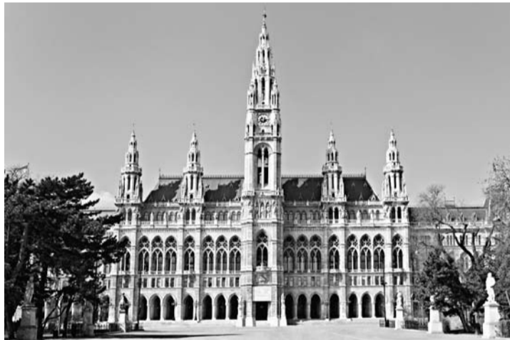
Городская ратуша в Вене

Выставки этого проекта Международного Центра Рерихов с 2014-го по 2016 год состоялись в 128 городах России при сотрудничестве с органами местной власти, музеями, галереями и рериховскими культурно-просветительскими организациями и продолжают в настоящее время. За последние годы «Пакт Рериха. История и современность» стал самым крупным проектом в России, посвященным делу охраны памятников культуры и Миру через Культуру.