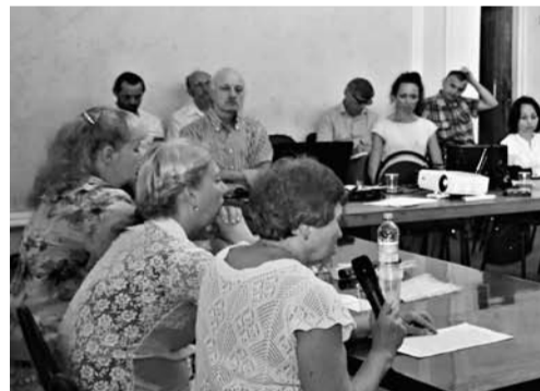
Участники круглого стола Международного общественно-научного форума