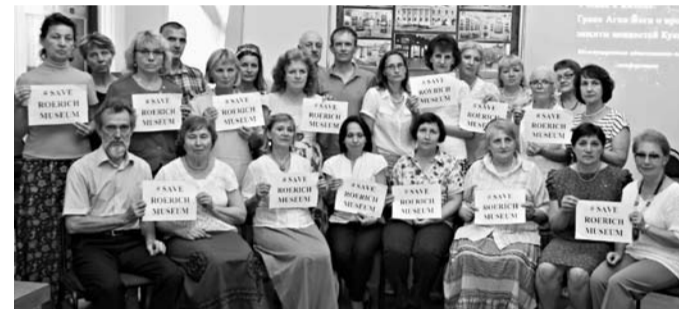
Участники акции #SaveRoerichMuseum

Участники форума подчеркнули, что проводимая руководством государственных институций политика по уничтожению уникального общественного Музея имени Н.К. Рериха привела к беспрецедентным событиям, произошедшим в музейном пространстве Москвы в марте – мае 2017 г. В эти дни ГМВ при поддержке и участии Министерства культуры, а также представителей силовых структур произвели захват зданий Музея, его коллекций и имущества.