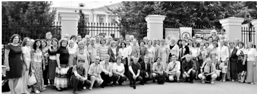
Участники Первых Шапошниковских чтений у общественного Музея им. Н.К. Рериха

желейшей тактикой»: «восстанием Огня» [6, 567]. Согласно энергетическому мировоззрению она действует, когда исчерпаны все земные возможности органично вписаться в ход мировой истории, а время уже не ждет, и уже больше невозможно отодвигать ярю наступающие космические сроки, сроки космической (!) истории. Новые энергетические силы мощно прорывают плотины прежних защитных заграждений и устремляются на Землю, на жизнь (!) на Земле. Они вызывают дисгармонию целого, оставляют после себя «зной бесплодной пустыни, выжженной коричневыми газами человеческой злобы и ненависти»,