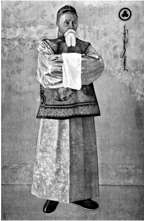
С.Н. Рерих. Портрет Н.К. Рериха. 1933 г.

Давайте подумаем, в какие залы первого этажа Главного дома собирается перевести Депозитарий Т.К. Мкртычев. Если имеются в виду выставочные залы, оборудованные Международным Центром Рерихов системами вентиляции и сигнализации, то музей лишится приличного выставочного пространства. Если же речь идет об административных помещениях, то необходимо будет разработать перегородки и паркетные полы, так как разводки системы вентиляции в сводчатых залах можно разместить только под полом. Для этого, возможно, придется поднимать уровень полов, в результате чего высота сводчатых палат, то есть расстояние от пола до сводов, значительно сократится. Более того, устанавливая оборудование вплотную к стенам не позволят своды. Также для обоих вариантов останется открытой проблема размещения в помещениях системы газового пожаротушения (в соответствии с действующими требованиями), которой оборудованы существующие помещения Депозитария МЦР. Необходимо будет найти помещения для новой вентиляционной камеры и новой станции пожаротушения. Все подобные планы потребуют разработки специальных проектов, их длительного согласования в различных инстанциях, начиная от Мосгорнаследия и Минкульты и заканчивая МВД и МЧС. Даже если в административных помещениях будет располагаться не депозитарий, а выставочные залы, то все эти работы также необходимо будет провести (за исключением системы пожаротушения). При этом может сократиться высота сводчатых помещений и, как следствие, выставочная площадь стен.