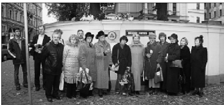
Члены Латвийского отделения МЦР.

« Н еобходимо защитить то самое главное, самое прекрасное в жизни, что принадлежит всем, общее достояние всего человечества – искусство, памяти древности – все, что дала нам наша культура», - эти слова Святослава Николаевича Рериха прозвучали в Риге 15 апреля 2005 года в литературно-музыкальной композиции, которую к дню годовщины Пакта Рериха подготовили члены Латвийского отделения МЦР. В тот день клуб «Друзья Живой Этики» собрал несколько десятков человек, которые пришли, чтобы вспомнить о том, как тяжел был путь красоты в минувший век великих потрясений и насколько ярко светил факел, который зажег великий подвижник