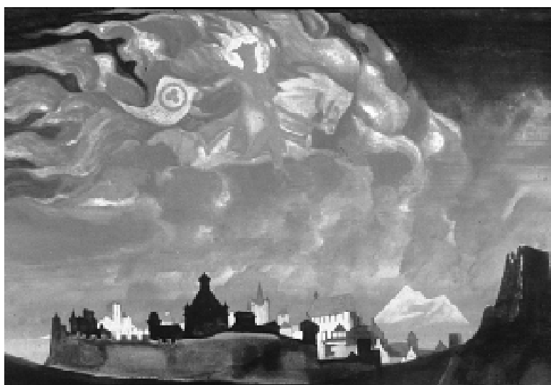
Н.К. Рерих. София-Премудрость. 1931 г.

<> Потому великое Знамя Мира несет свои заряды Света и огненно насыщает токи вокруг Земли как панацея против зла. Так сознания, объединенные веками, творят. Так Свет побеждает тьму. Так совершается прекрасная ступень. Так приходит предуганное.