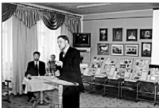
Круглый стол «Проблемы охраны и популяризации культурного наследия Хмельниччины».