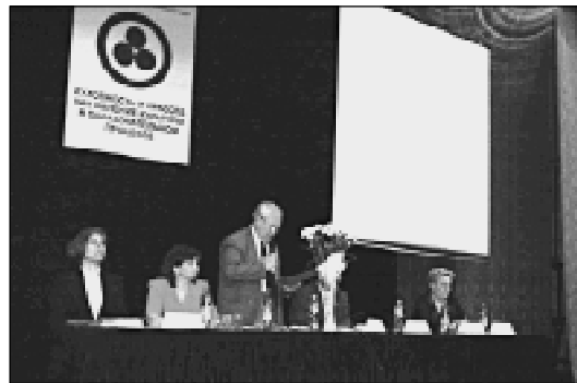
Вторая международная научно-практическая конференция «Духовность и Красота как явление Культуры в образовательном процессе», посвященная 70-летию Пакта.