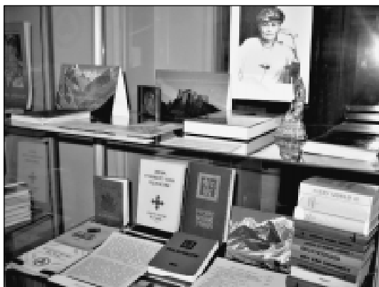
Выставка «Мир через Культуру», г. Таллинн.

С 4 по 28 января 2005 г. в выставочном зале Таллиннской центральной библиотеки прошла организованная Эстонским обществом Рериха выставка «Мир через культуру»,