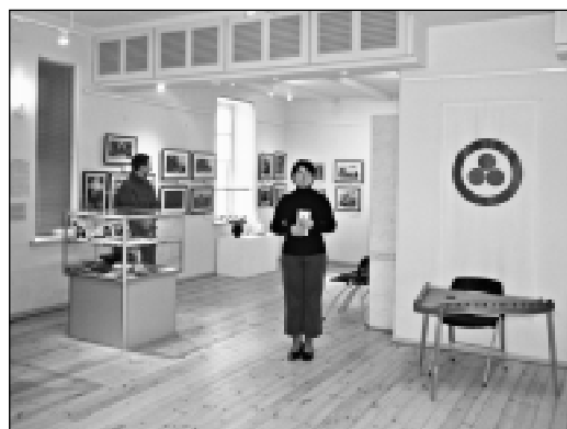
Выставка «Мир через Культуру», г. Кейла.