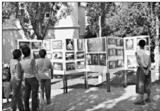
Выставка фотодокументов о ратификации Пакта Рериха и репродукций картин Н.К. и С.Н. Рерихов.

В день пожилого человека в ДЦ «Современник» открылась выставка репродукций картин Н.К. Рериха, посвященная 60-летию Победы, где