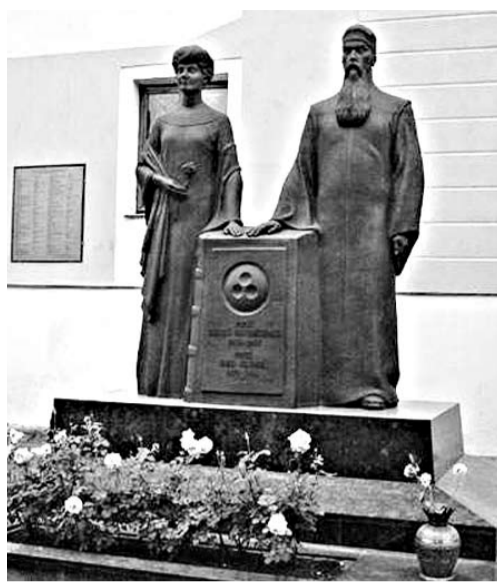
Центр-Музей имени Н.К. Рериха

Но это еще не все. Когда сел наш самолет, в 12 часов ночи, и загрузили мой груз в отдельный отсек, командир сказал мне, что у