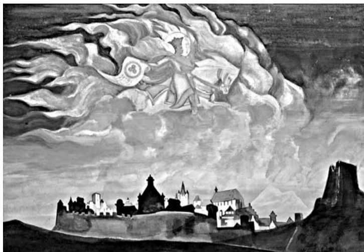
Н.К. Рерих. София-Премудрость. 1932

ства и их творцов сделали до боли очевидной необходимость предотвратить новые трагедии, научиться разрешать межнациональные, классовые, религиозные конфликты бескровными способами. Идеи Пакта Рериха, утверждающие безусловную защиту исторических памятников, музеев, научных, художественных, образовательных и культурных учреждений и их сотрудников в мирное и военное время, приобретают сегодня особую актуальность. «Не устанем твердить, – писал Н.К. Рерих, – что, кроме государственного признания, нужно деятельное участие общественности. Культурные ценности украшают и возвышают жизнь от мала до велика. И потому деятельная забота о них должна быть проявлена всеми».