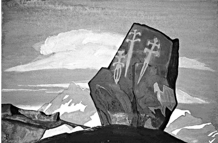
Н.К. Рерих. Три меча. 1932

жимом общественности МЦР было «позволено» принять участие в обсуждении проблем, которые данная организация успешно решает вот уже несколько десятков лет. Однако буквально накануне начала работы круглого стола Международному Центру Рерихов вновь было отказано в СЛОВЕ. Таким образом, в лице МЦР организаторы заседания выразили недоверие тем международным сообществам, членом которых Центр-Музей является: ЭКОСОС ООН, ДОО ООН, Международной Организации Национальных Трастов, Международному совету музеев (ИКОМ), Всеевропейской федерации по культурному наследию «ЕВРОПА НОСТРА».