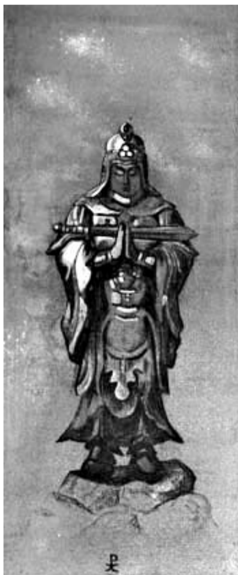
Н.К. Рерих. Меч мира. 1933

«Высшее в космической эволюции ведет низшее» – об этом свидетельствуют Космический закон и наше продвижение по ступеням Космической эволюции. Наша планета трехмерного измерения пытается сейчас подняться в новую, Шестую эпоху. Пусть всем нам сопутствует удача в этом трудном и сложном творчестве.