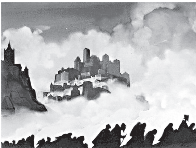
Н.К. Рерих. Армагеддон. 1936