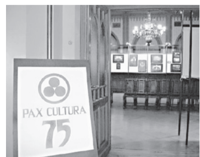
Выставка, посвященная Пакту Рериха и Знамени Мира, г. Рига