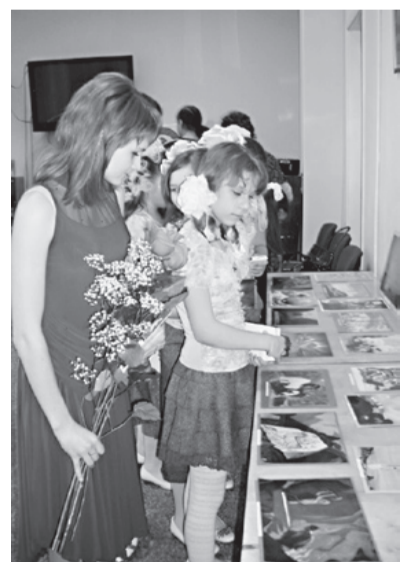
На презентации альманаха

28 марта в Мурманской областной научной библиотеке прошла конференция «Красота спасет мир», организованная Мурманским рериховским обществом и посвященная 75-летию Пакта Рериха и