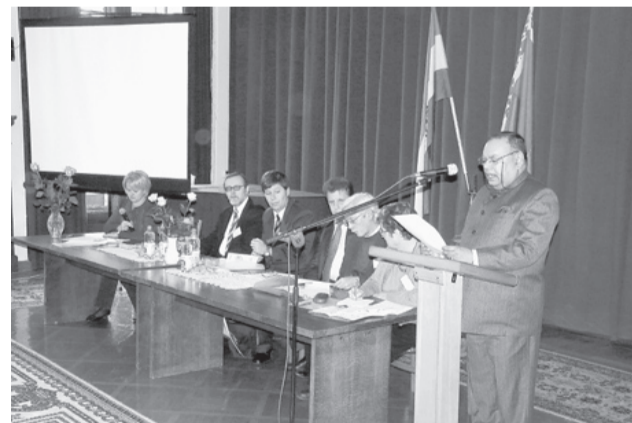
Международная научно-общественная конференция «Великое культурное наследие Индии и Беларуси. К 75-летию Пакта Рериха»