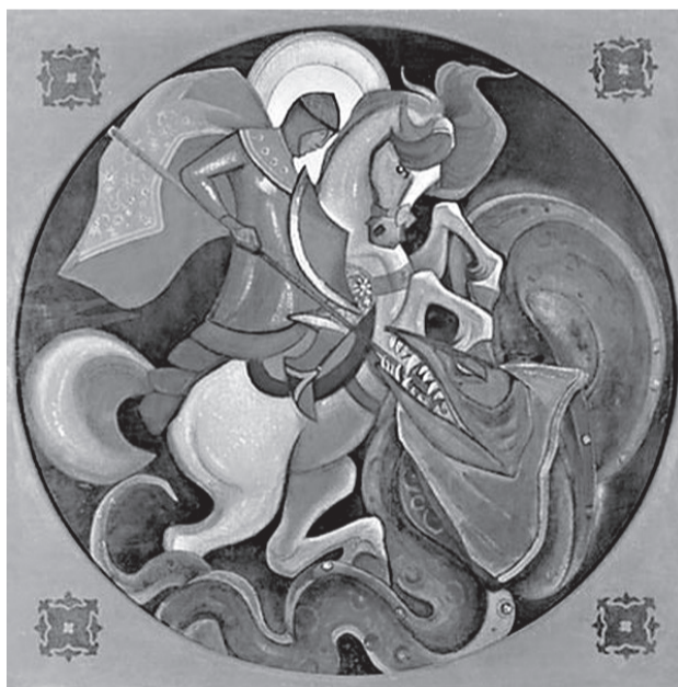
Н.К. Рерих. Свет побеждает тьму. 1933

Знамя Мира профессора Рериха провозглашает созидательную цель культурного достижения, поднимает культурные ценности и заставляет людей осознать безумие разрушения. Уничтожая вооружения и трусливо убегая в безопасное место, под прикрытием безответственных слов и заявлений, мы никогда не достигнем цели «мира без войны». <...>