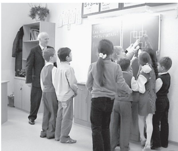
Ш.А. Амонашвили на семинаре, г. Владивосток