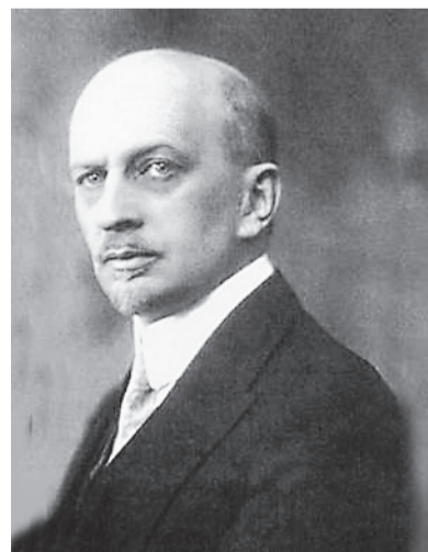
И.А. Ильин, философ, мыслитель, правовед, публицист, литературный критик (1883 - 1954)

вах. Вековые усилия совести, очевидности, вкуса, направленные на выработку твердой точки зрения и истинности различий, на победу над ложью, на преодоление соблазнов, на безупречность суждений, кажутся, рушатся, и их место занимает первозданный духовный хаос. Отец лжи празднует свой триумф и порочит все возвышенное, чистое, Божественное, а опороченному порядочному человеку утешением служит лишь то, что он разделяет судьбу духовных ценностей.