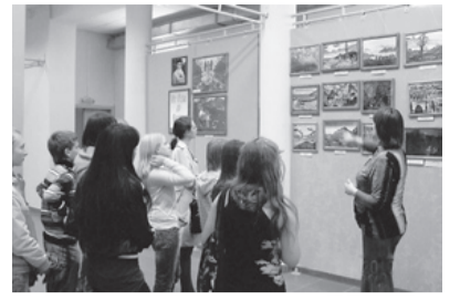
На выставке репродукций картин Н.К. Рериха

14 мая в малом зале Омского музыкального училища имени В.Я. Шубалина состоялся концерт молодых композиторов класса преподавателя С.И. Кудрявцевой. Юные дарования