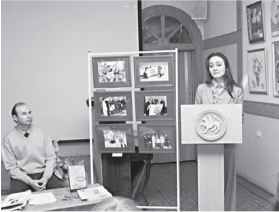
В Республиканской юношеской библиотеке г. Казани