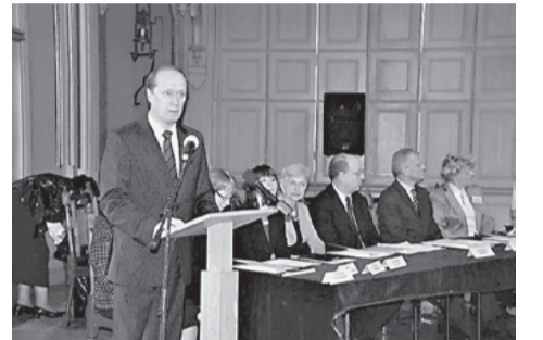
А.А. Вешняков, Посол России в Латвии