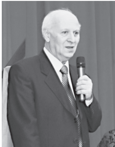
Ш.А. Амонашвили, Девятые Международные педагогические чтения «Чтобы дарить Ребенку искорку знаний, учителю надо впитать море Света»

Фрагменты из выступления Шалвы Александровича Амонашвили