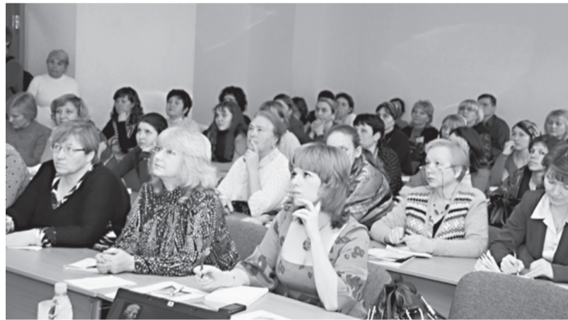
Девятые Международные педагогические чтения

– развивать в них возвышенные образы и устремления к прекрасному.