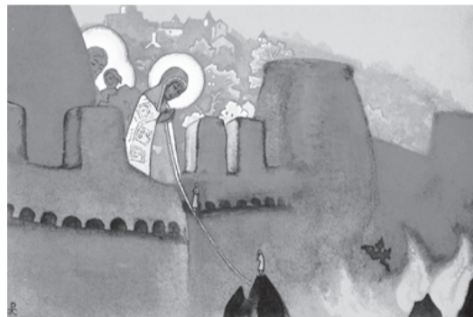
Н.К. Рерих. Мадонна Лаборис. 1933

Заявление поддержали 44 рериховские организации.