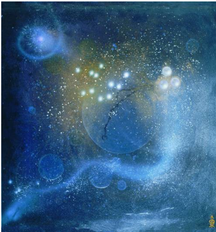
О. Высоцкий. Серия "Дыхание Космоса"

Жизнь человека – как песчинка в Мироздании, Но дух – как Вечностью зажжённая звезда ... Земное и космическое в новом понимании Не делимы друг от друга никогда.