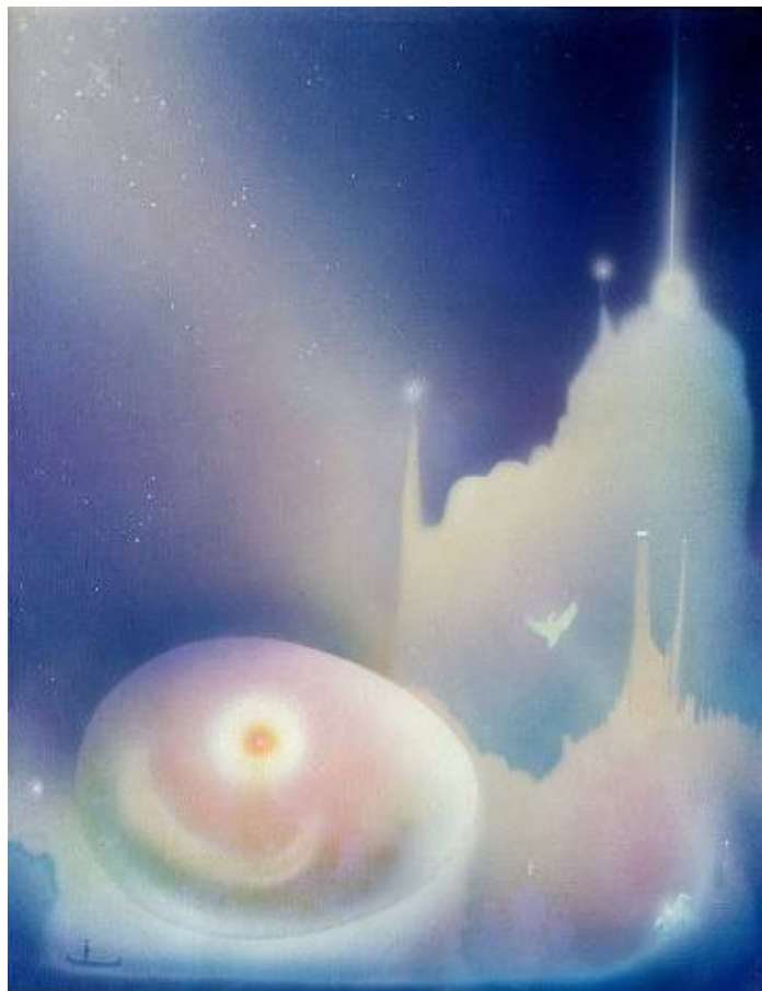
О. Высоцкий. Путь