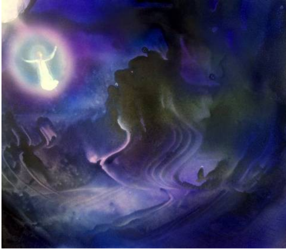
О. Высоцкий. Серия "Рождение Знака"

Для дня вчерашнего я умираю, Чтоб возродиться для другого дня. Что в этом новом дне познаю? - Его неведомость манит меня, В дыханье каждом свежесть обновленья... Невидимо наш дух растёт. На вечных узких тропах восхожденья, Я сердца огненный ищу восход.