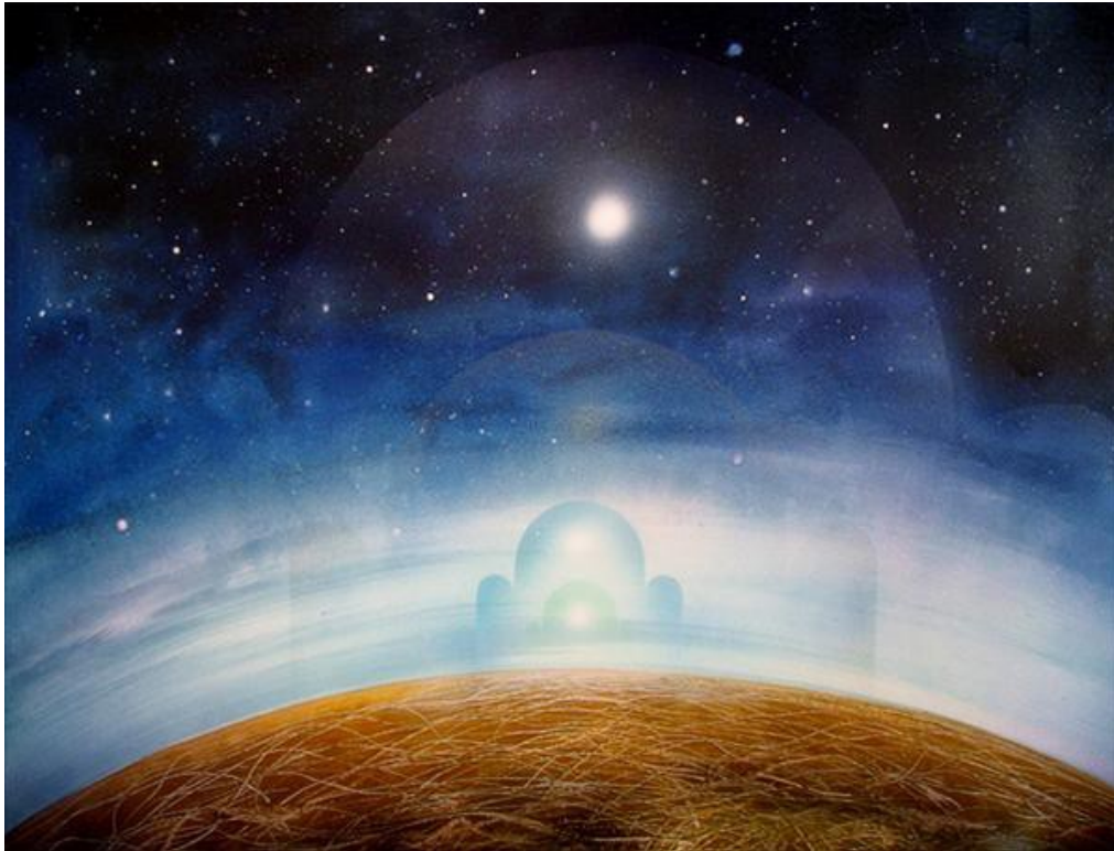
О. Высоцкий. Серия «Храм»

Вы ужин дружеский - не тризну мне устройте, И скрипка огненно весь вечер пусть поёт... А напоследок вы труды мои раскройте, И дух мой к вам немедленно придёт.