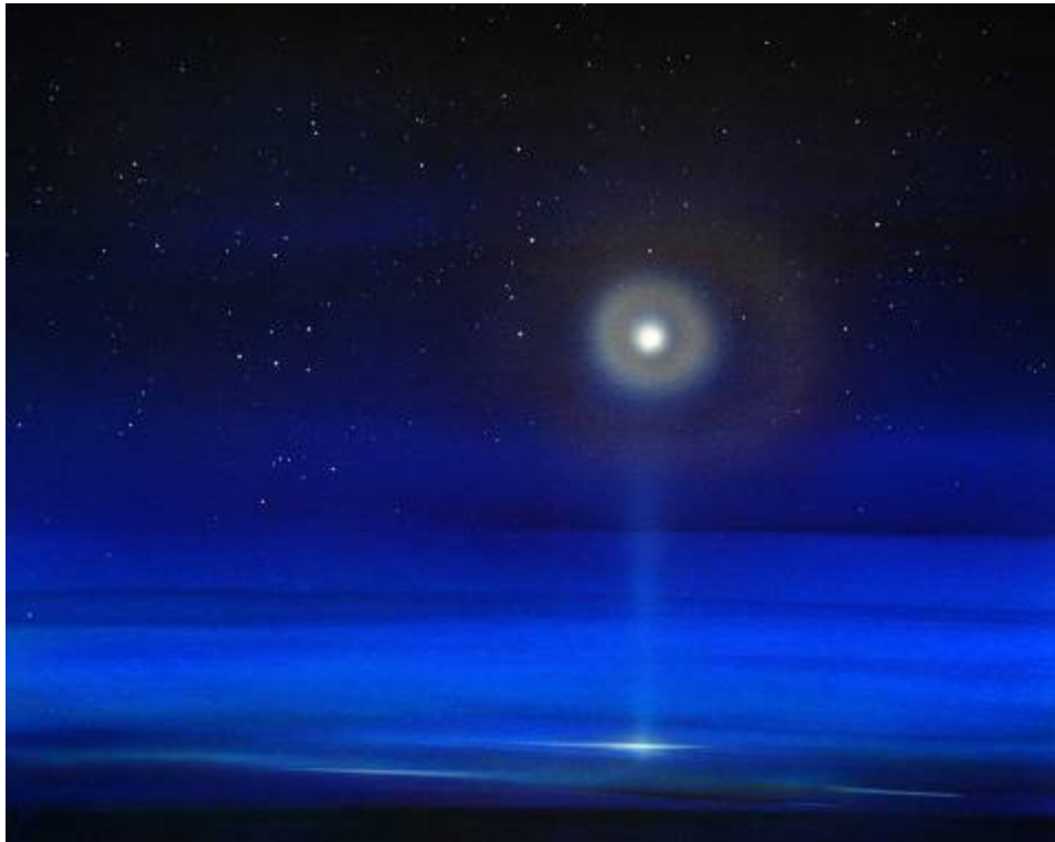
О. Высоцкий. Серия «Silentium»