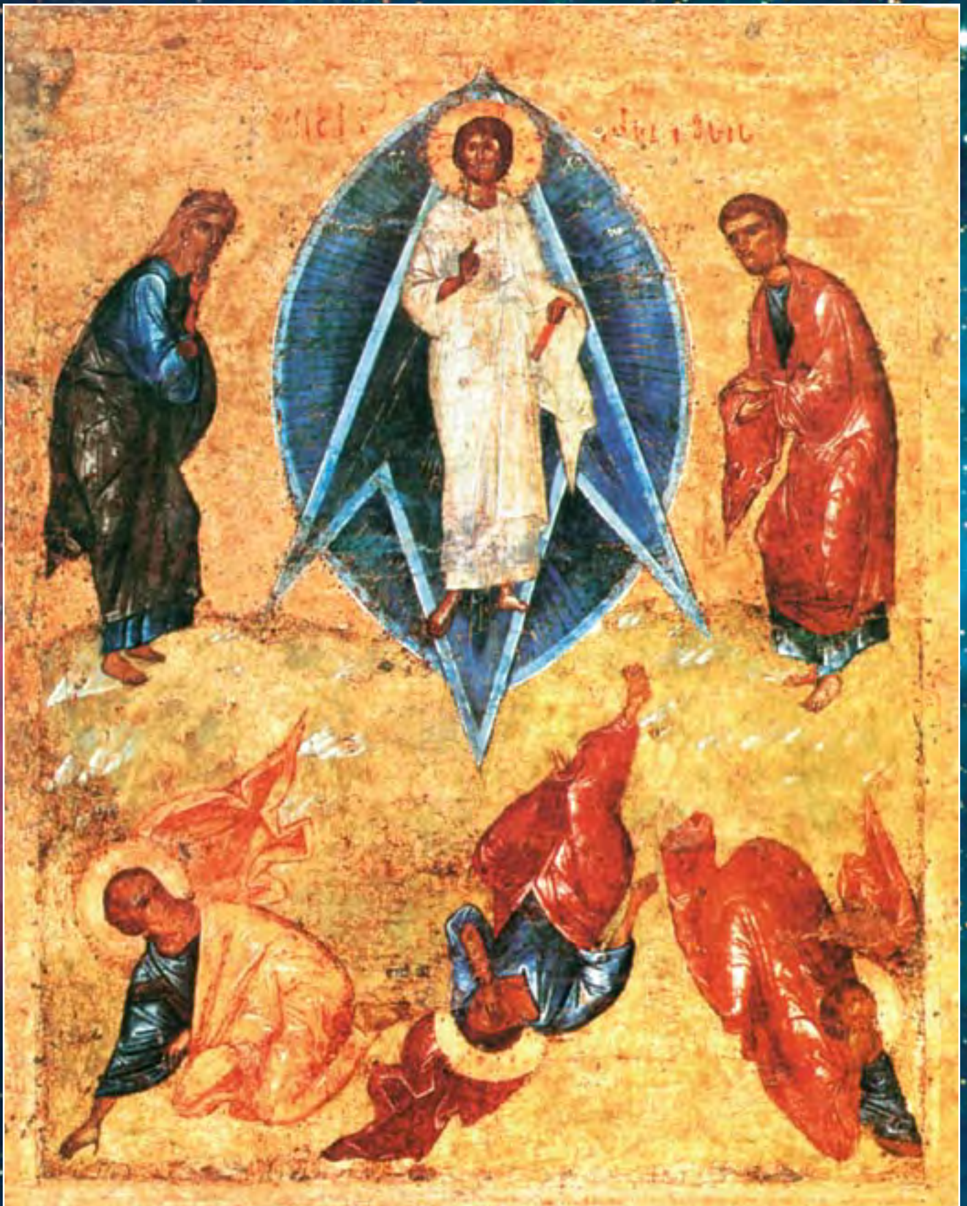
Преображение. Икона. XIII в.