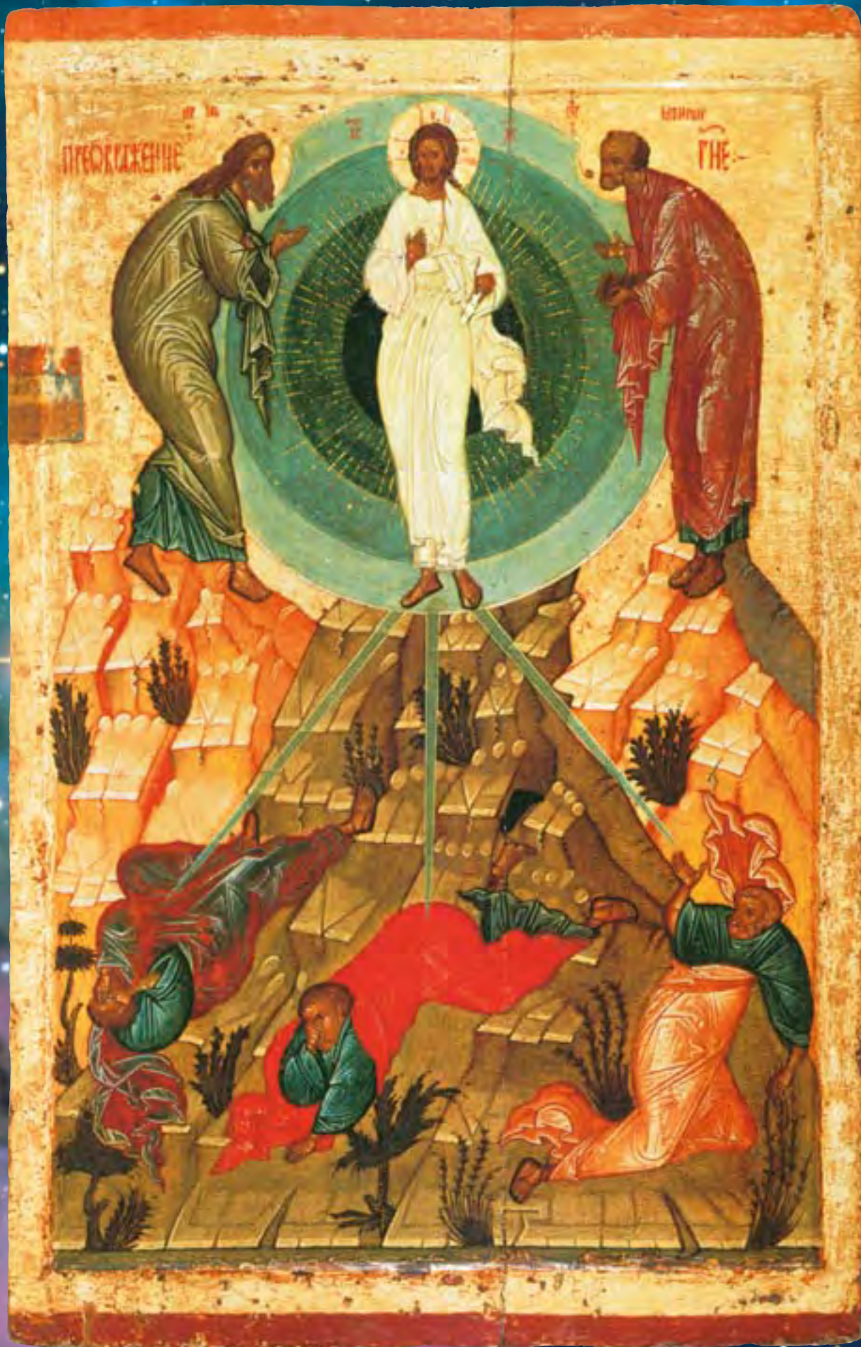
Преображение. Икона. Последняя четверть XV в.