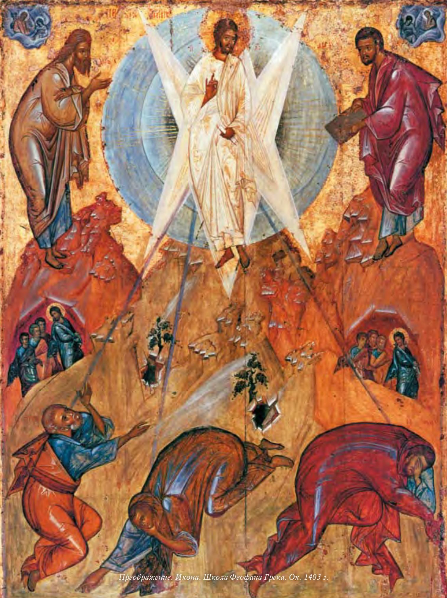
Преображение. Икона. Школа Феофана Грека. Ок. 1403 г.