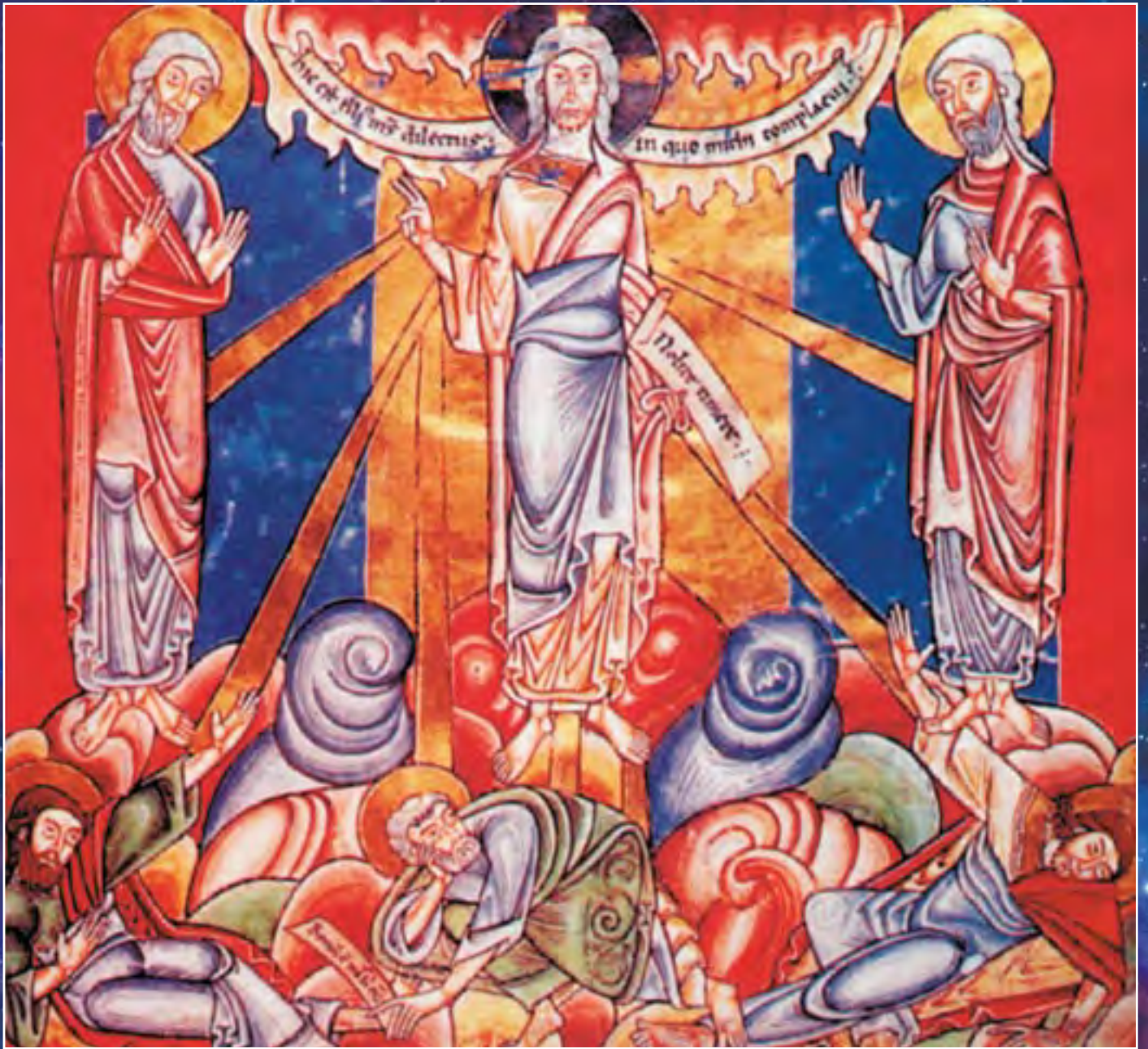
Преображение. Икона. XII в. Византия