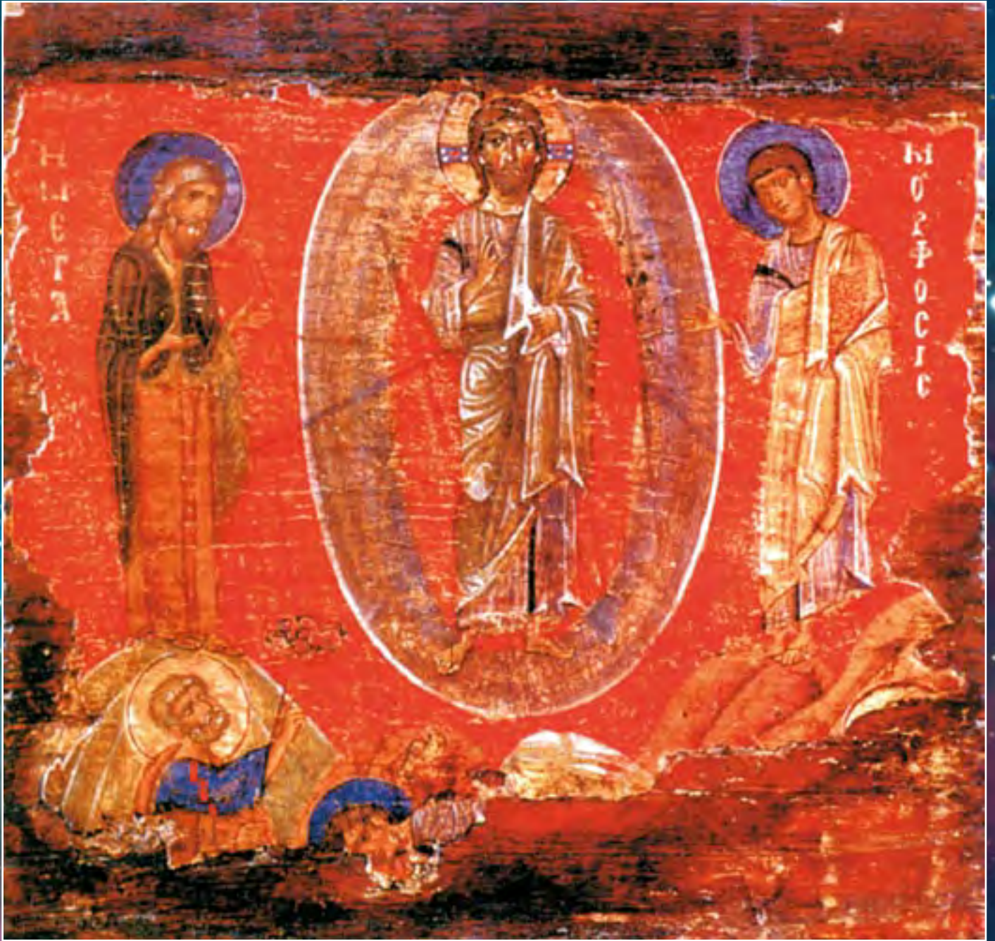
Преображение. Икона. XII в. Византия