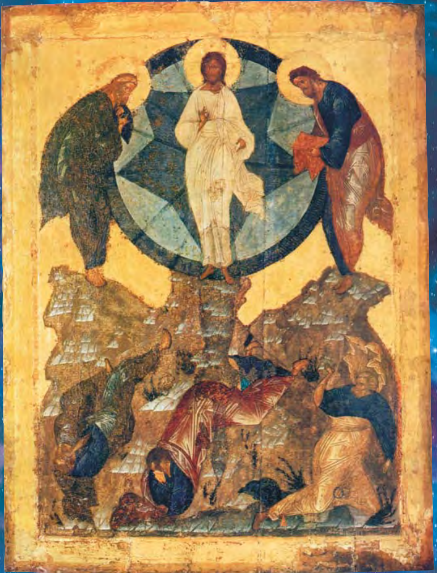
Преображение. Икона. 1490-е гг.