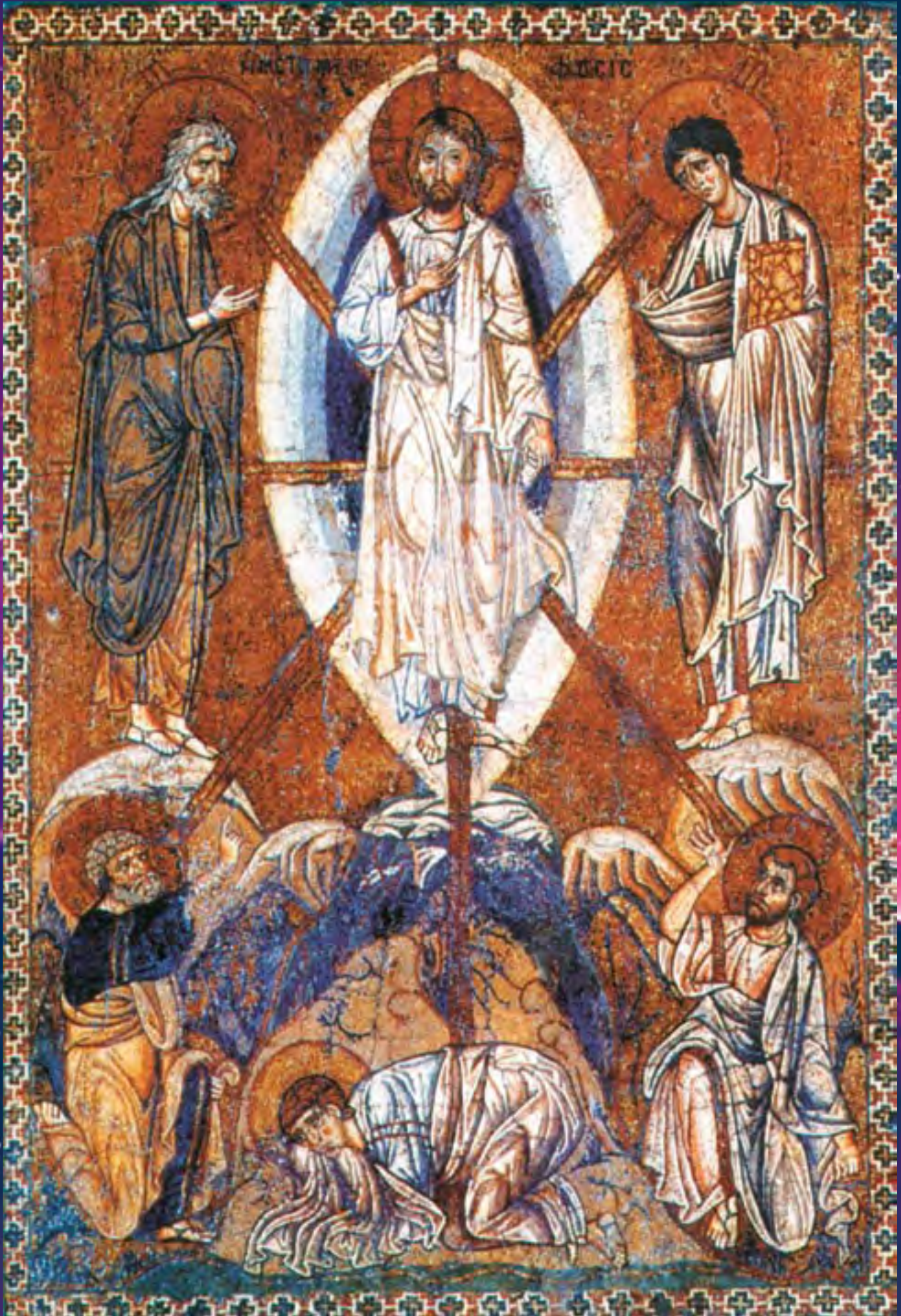
Преображение. Мозаичная икона. Первая половина XII в. Византия