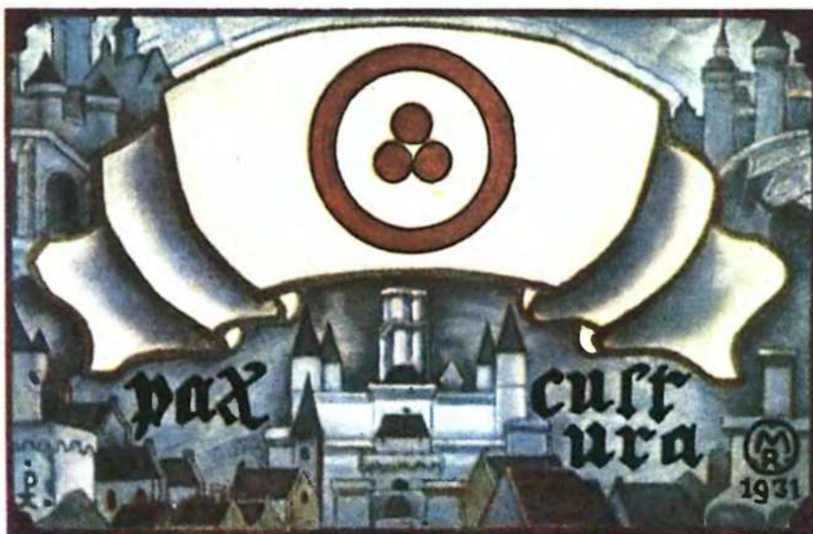
Н. Рерих. Знамя мира.

Красная оруженность с тремя красными кружками посредине — этот символ должен быть, по замыслу Н. К. Рериха, на всех памятниках культуры. Были предложены различные толкования этого символа, из которых наиболее распространенными являются: «наука, искусство и философия как проявление культуры» или «прошлые, настоящие и будущие достижения человечества, оруженные кольцом времени вечности» (см. статью «Пакт Рериха»). «Оба эти истолкования одинаково хороши», — говорил Н. К. Рерих.