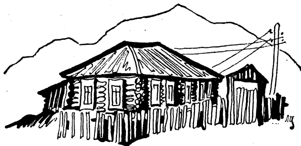
Дом в с. Верхний Уймон, где жил Н. К. Рерих