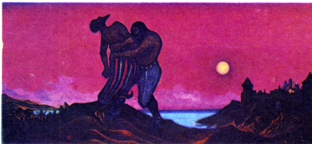
Единоборство Мстислава с Рюрикю.