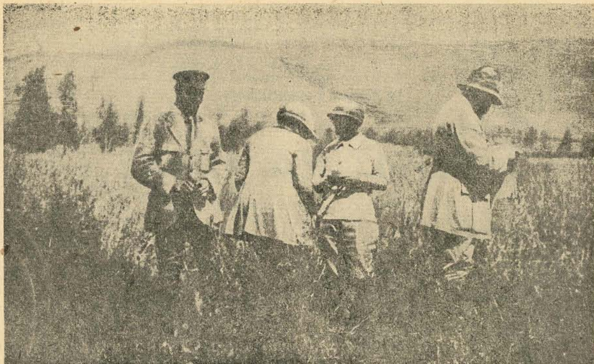
Экспедиция Н. Рериха на Алтай.