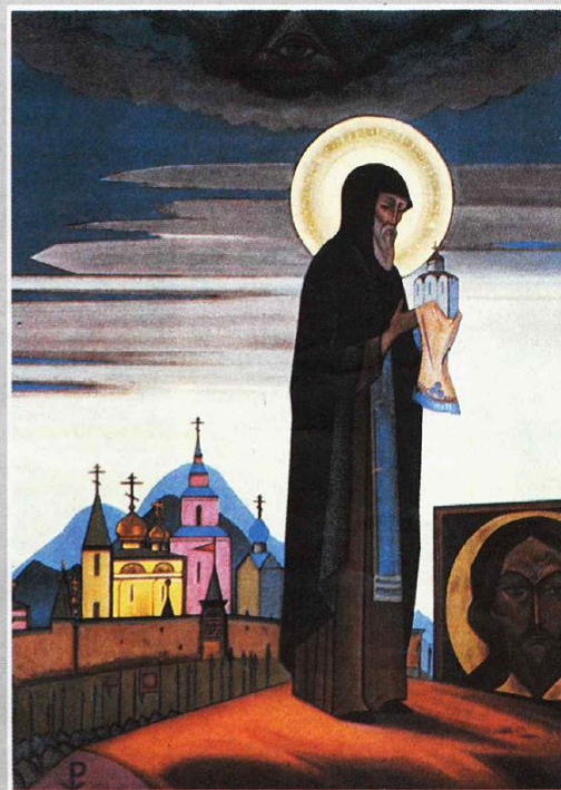
Н. К. Рерих. СВЯТОЙ СЕРГИЙ. 1932.