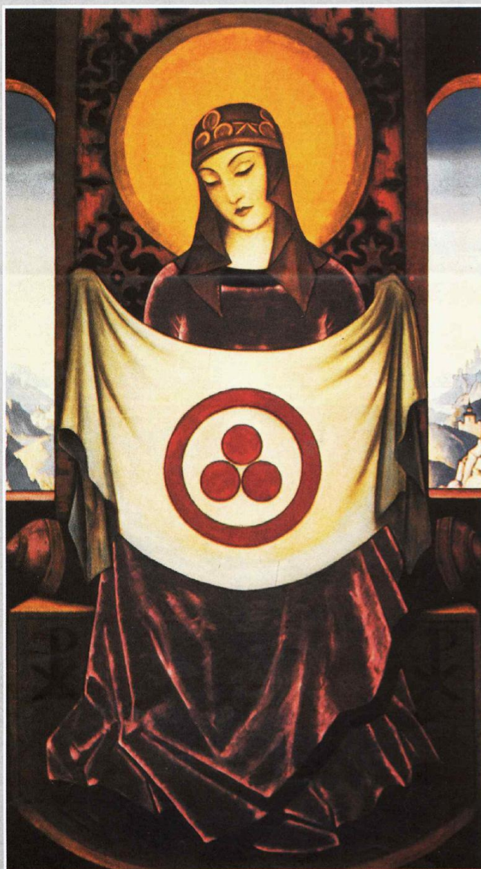
Н. К. Рерих. МАДОННА ОРИФЛАММА. 1932.