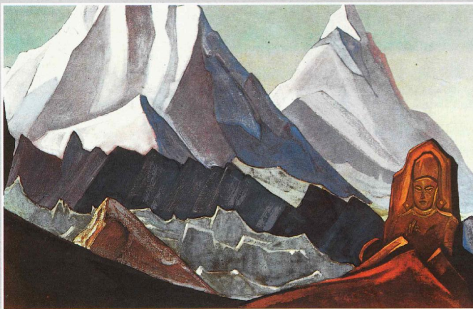
Н. К. Рерих. МАЙТРЕЙЯ. 1932.