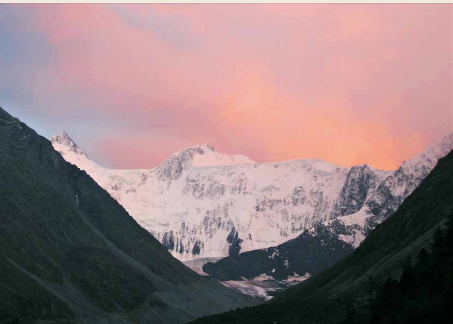
Вид на Белуху с Аккемского озера

ность Алтая для всей планеты, что впоследствии пробудило огромный интерес к этому региону.