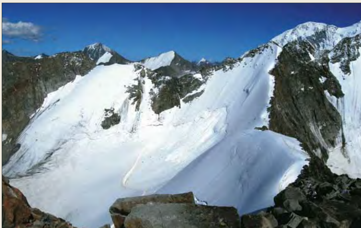
Вершина, на которую было совершено восхождение юбилейной экспедиции