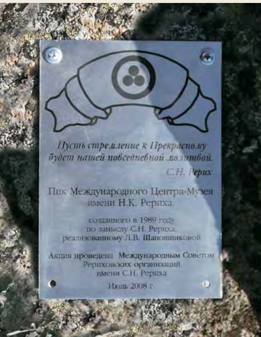
Памятная табличка на вершине

самого высокого уважения, но особая благодарность всем тем членам экспедиции, кто своим незримым участием – добрыми мыслями, молитвами – также были на этой вершине.