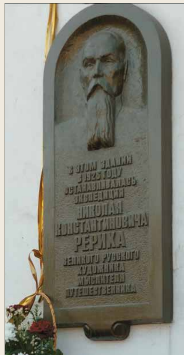
Мемориальная плита в честь пребывания экспедиции Н.К. Рериха в Бийске

Мы шли маршрутом Мастера, мы возносили Мастеру нашу благодарность, и самое большое, о чем мечтали, – достойно продолжить его дело. Чтобы не произошло «оземления» великих идей, чтобы заложенные магниты мощно работали в пространстве, привлекая к себе готовые к восприятию сознания.