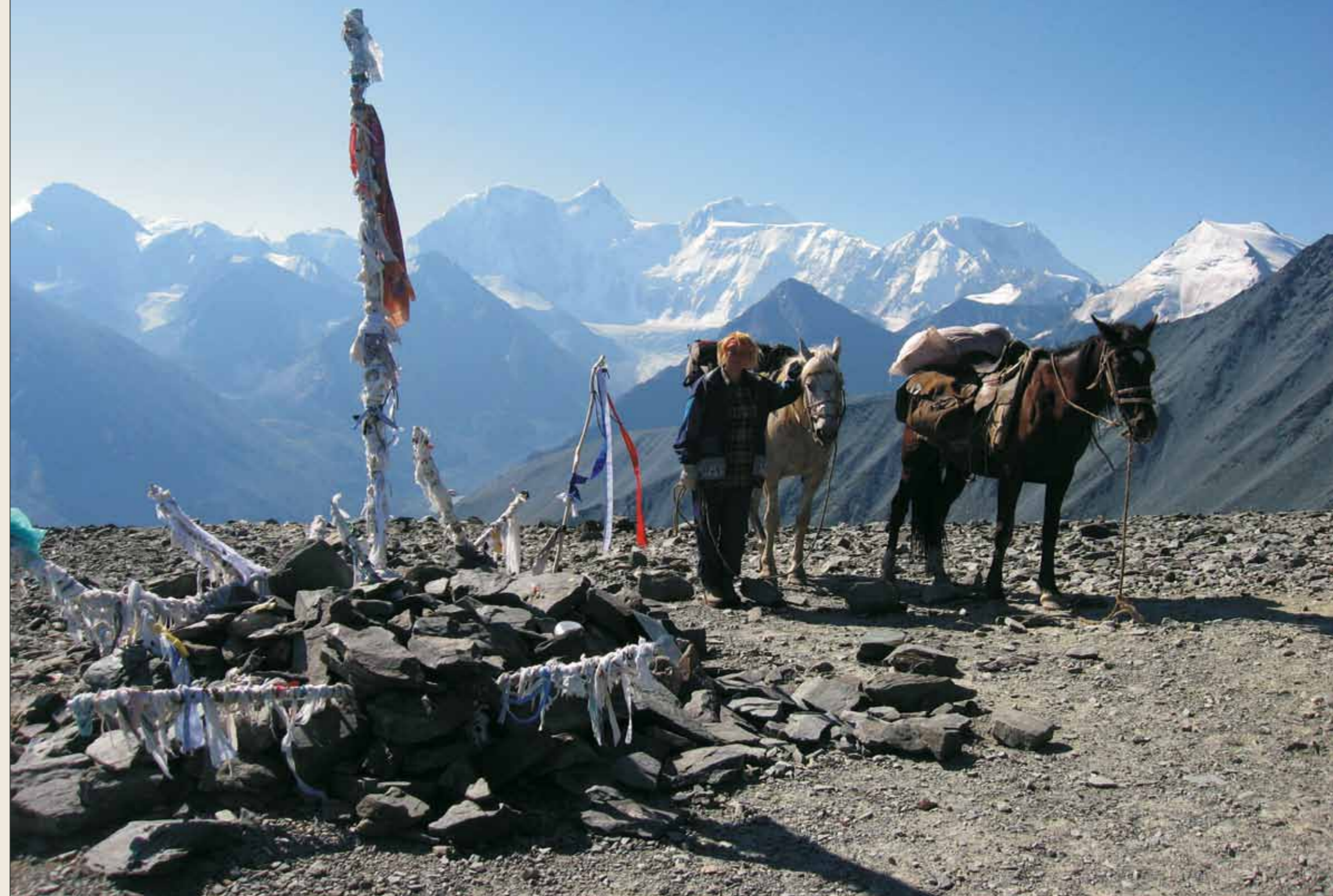
Перевал Каратюрек. Вид на гору Белуха