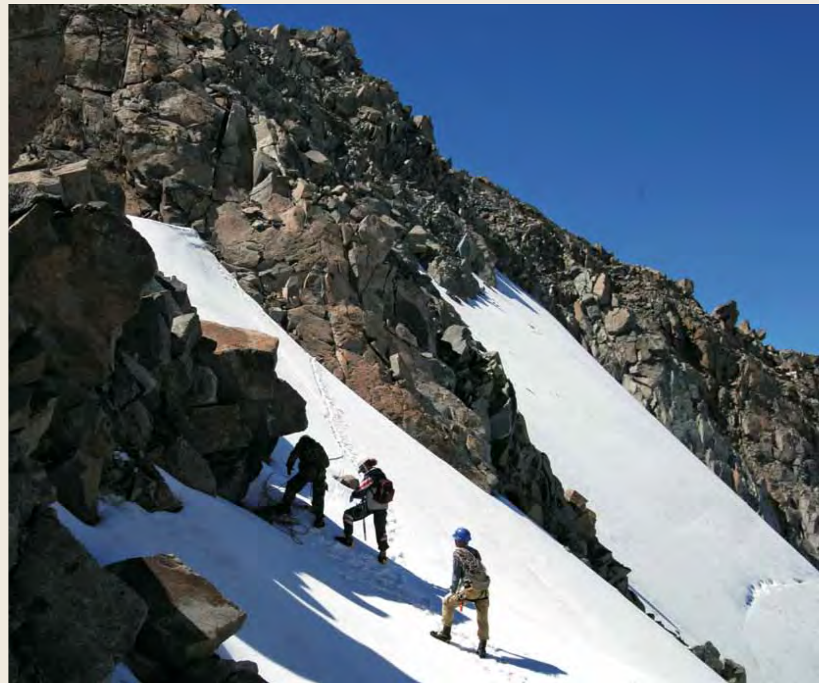
Восхождение в честь МЦР с северной стороны ▶