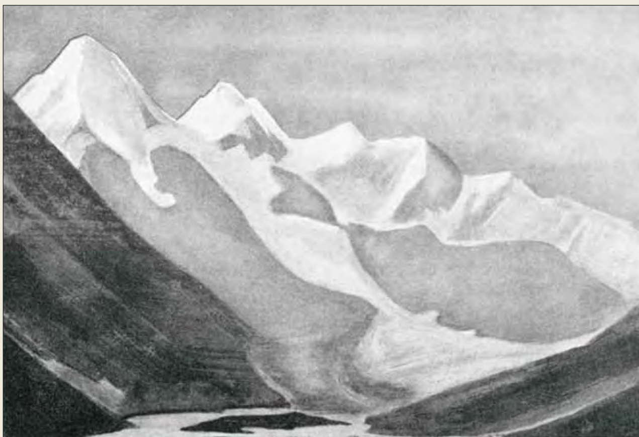
Н.К. Рерих. Белуха

ла, Степан хитро улыбнулся и сказал: «Так я уже пожилой».