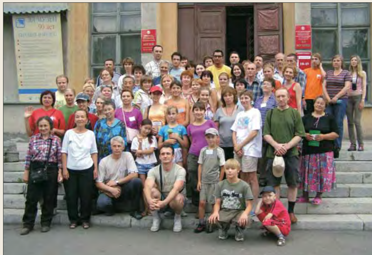
Участники экспедиционной программы. Краеведческий музей, г. Горно-Алтайск

Не секрет, что Алтай давно уже исхожен как учеными, так и многочисленными группами туристов. Многие вершины уже имеют названия, поэтому необходимо было выяснить, имеет ли официальное название эта вершина. По возвращении домой сделала необходимый запрос в Службу геодезии и картографии и получила обнадеживающий ответ: по официальным данным, вершина пока безымянна.