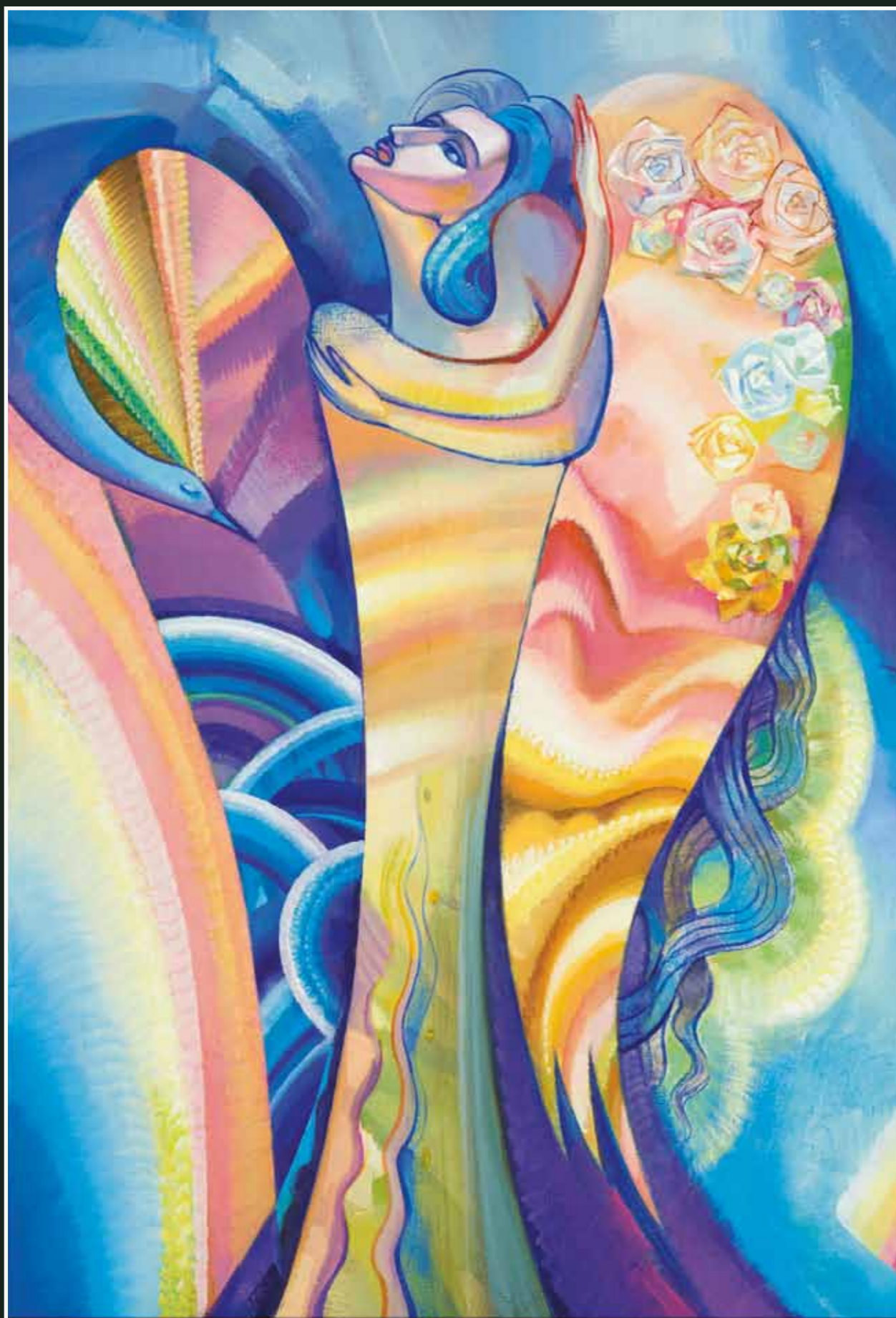
Г. Карепов. Поющий Ангел. 2004