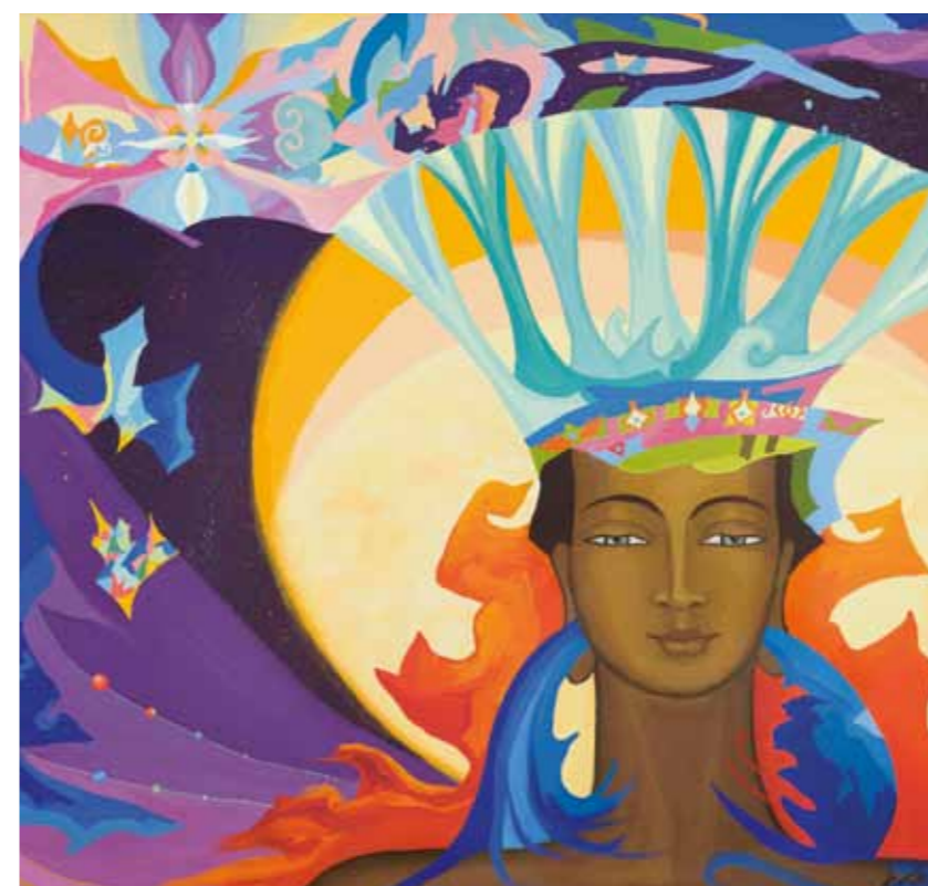
Феодосия. Авасан. 2001