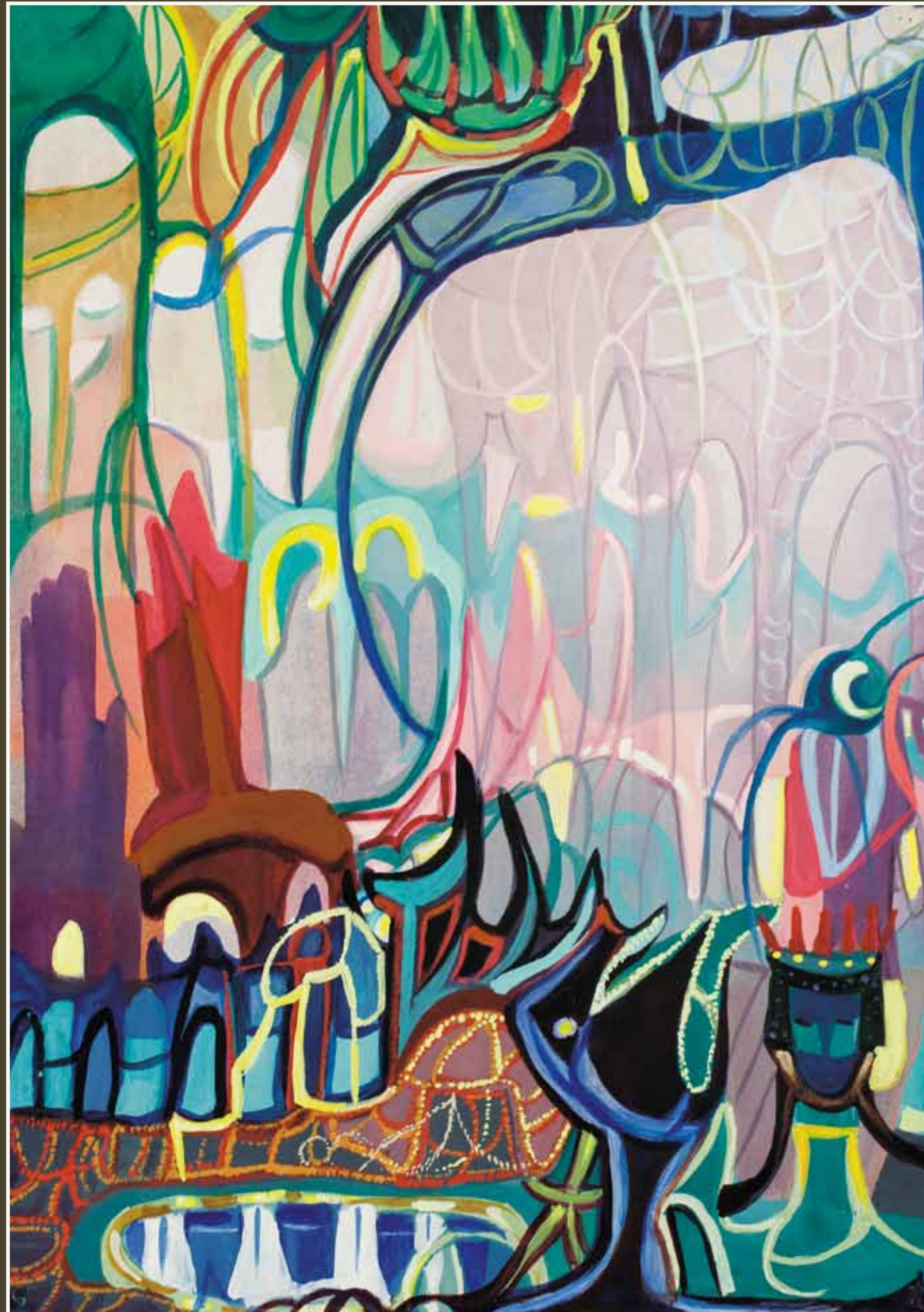
В.Ф. Черноволенко. Скерцо. 1969

софские устои, продолжающие традиции изобразительного искусства Серебряного века.