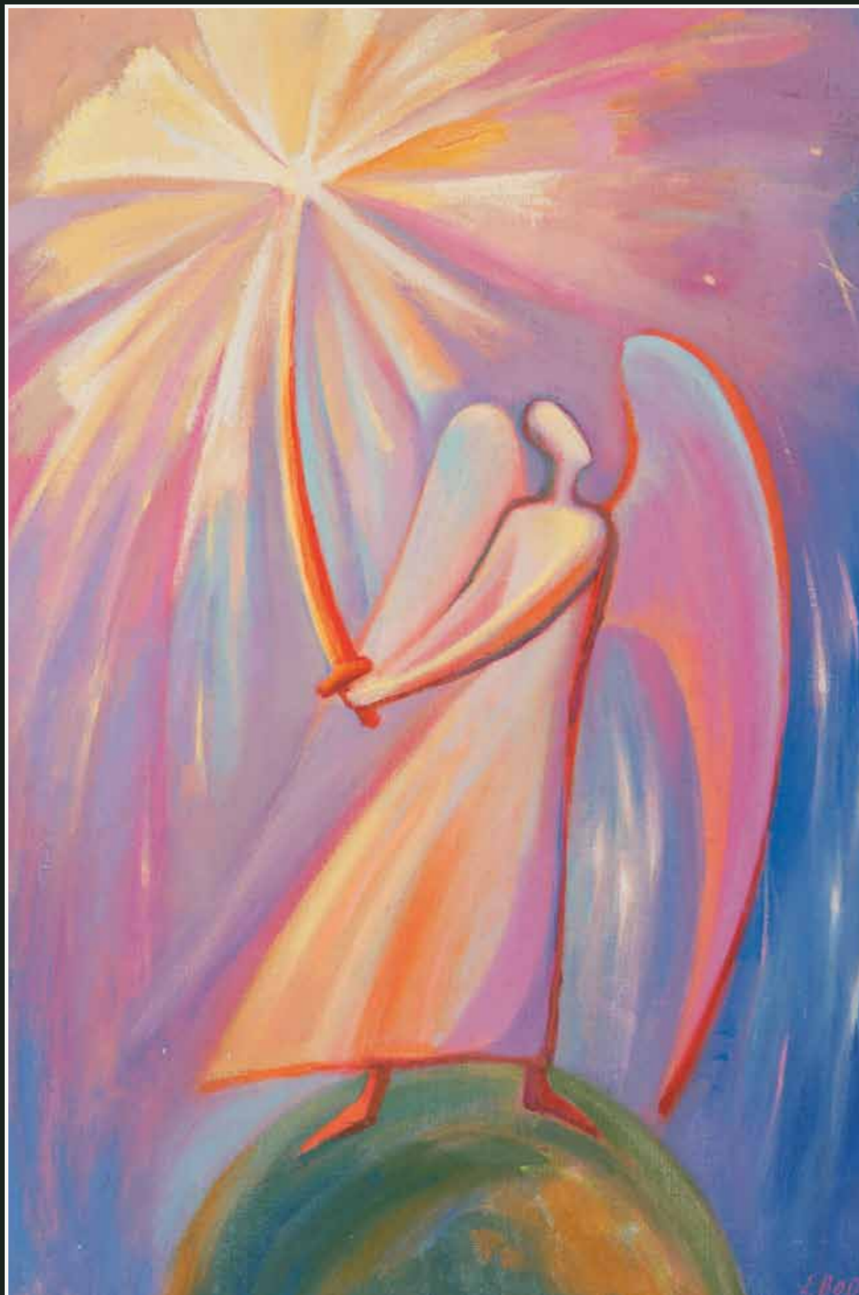
Е. Войнова. Ангел с мечом. 2006