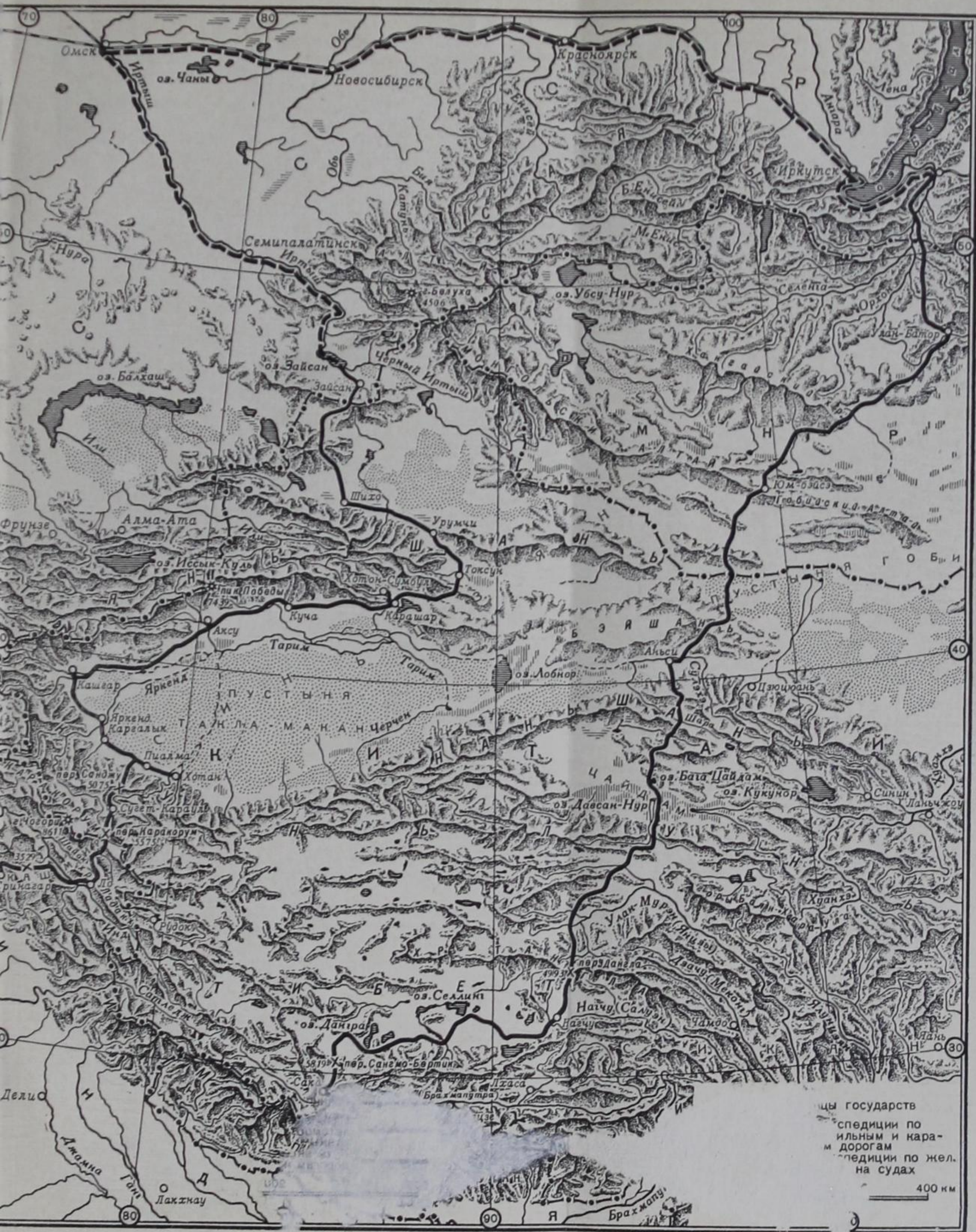
Путешествие Н. К. Рёриха