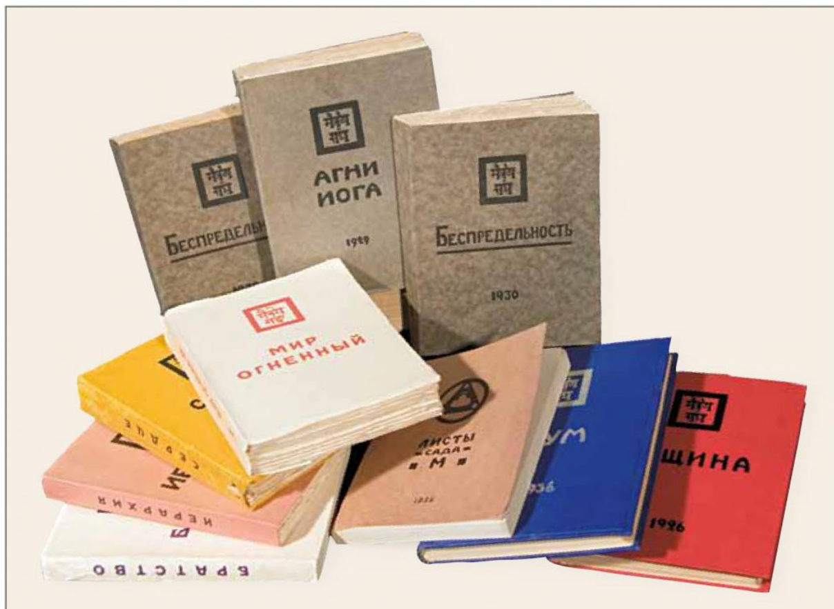
Первые издания книг Живой Этики

ков об опасностях и соблазнах духовного пути, не обещает им легких достижений и волшебных трансформаций своей низшей природы. «Князь Мира сего имеет много талантливых, сознательных и бессознательных пособников, и наивно думать, что они не умеют действовать тонко. Они очень изысканны и изобретательны и действуют по сознанию своих жертв. Но все они лишены теплоты сердца... Только сила преданности и устремления к служению Великой Иерархии Света может спасти от широко расставленных сетей Князя Мира сего» 55 .