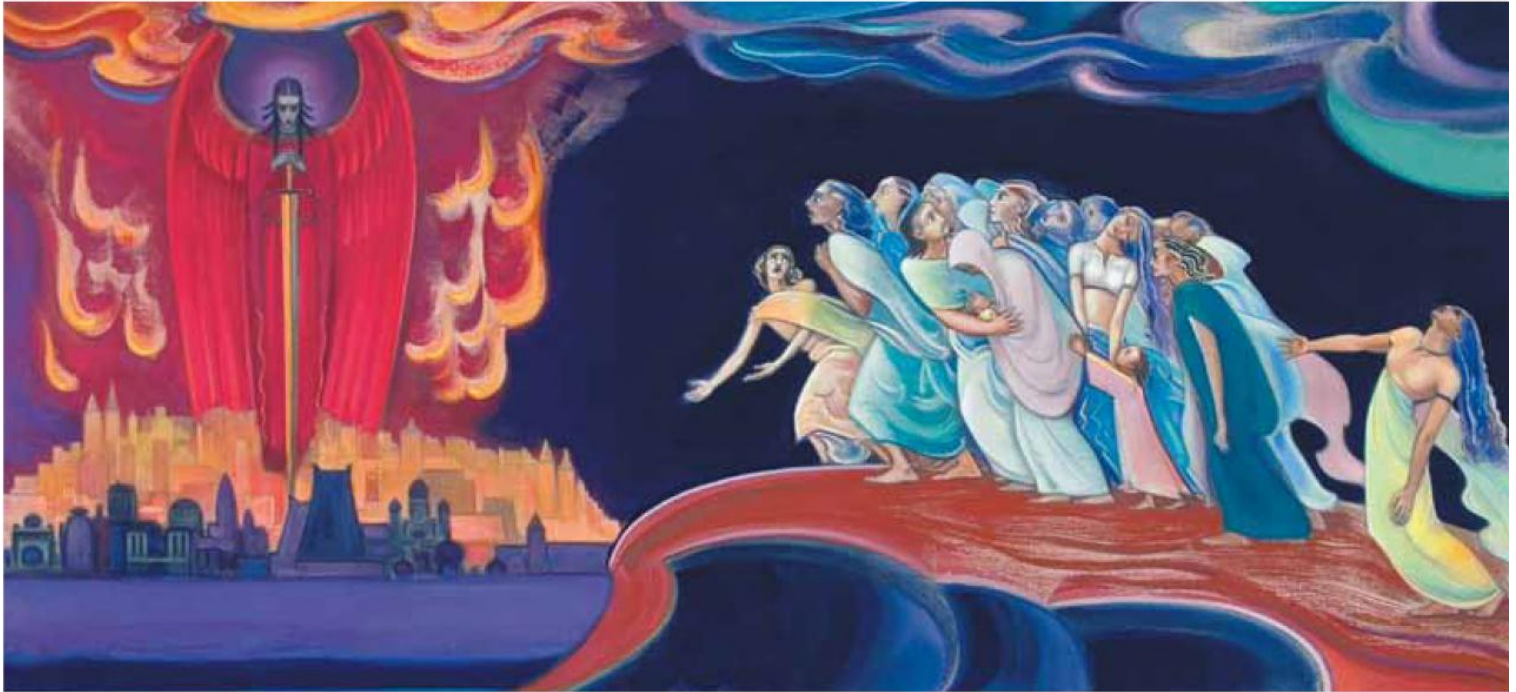
С.Н. Рерих. Воззри, человечество . 1962

Как сказано в Буддизме: «Невежество есть корень всех бедствий». Осознание этой истины дает стимул к познанию и, следовательно, к эволюции» 89 . Невежество уничтожается только знанием. Знания, принесенные нам Великими Духами, исцеляют и делают человека свободным, но эти знания должны попасть на соответствующую почву, их нужно суметь воспринять, продумать и применить; кроме того, за свободу нужно сражаться, освобождаясь от зла внутри себя. Только при этом условии можно распознать и одолеть внешние нападки, ибо зацепить нас тьма может только в случае резонанса, когда нечто в нас соответствует, гармонирует, согласуется с воздействием извне и откликается на него. В противном случае Тьма рассеивается Светом – это физический закон.