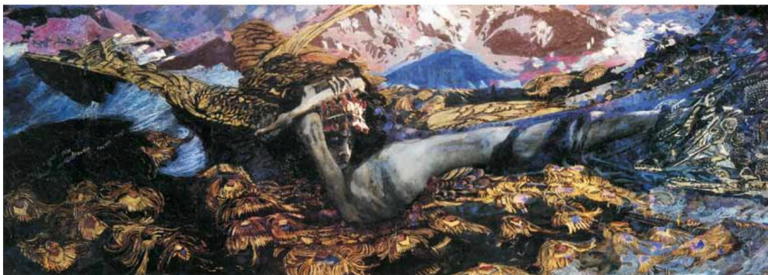
М.А. Врубель. Демон поверженный. [1902]