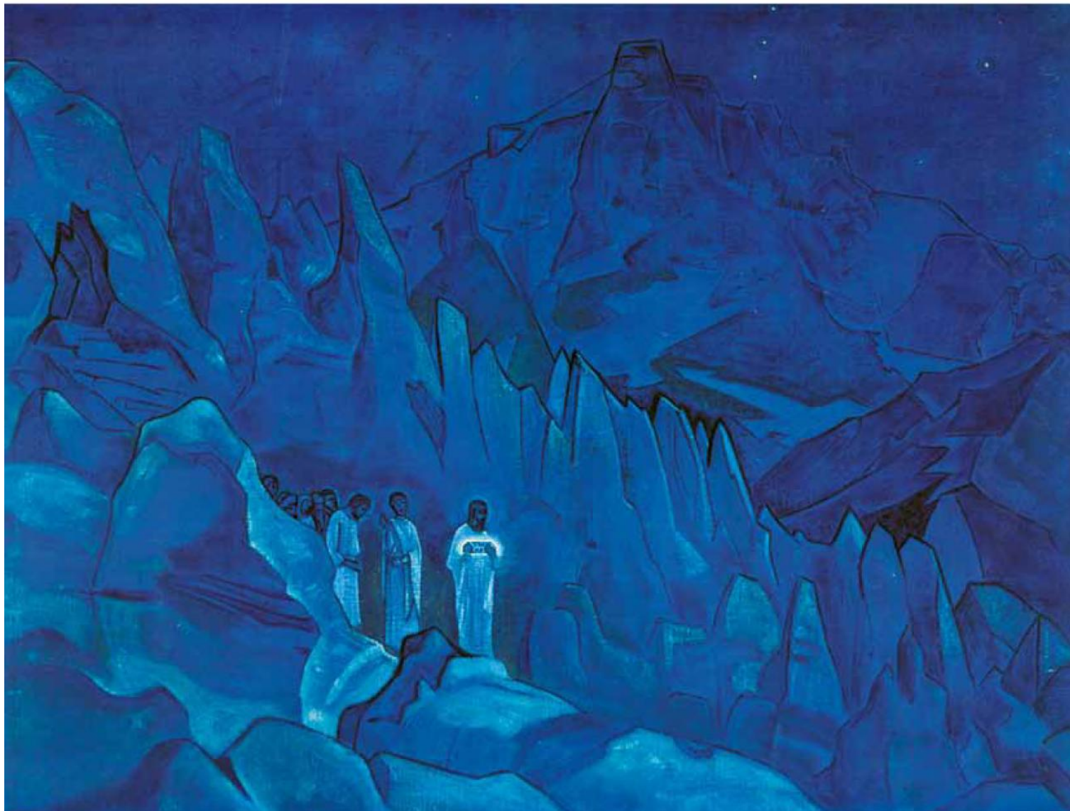
Н.К. Рерих. Сожжение тьмы. 1934

стве следствий, бессмысленно. «Для поворота эволюции нужно перестроить всю жизнь» 71 , – говорится в Учении. При этом точка приложения наших усилий должна быть внутри, а не снаружи. «Не будем называть эти напоминания нравственными советами. Пусть люди назовут их физическими и механическими законами. Совершенно безразлично, как назвать основы бытия, лишь бы они соблюдались!» 72