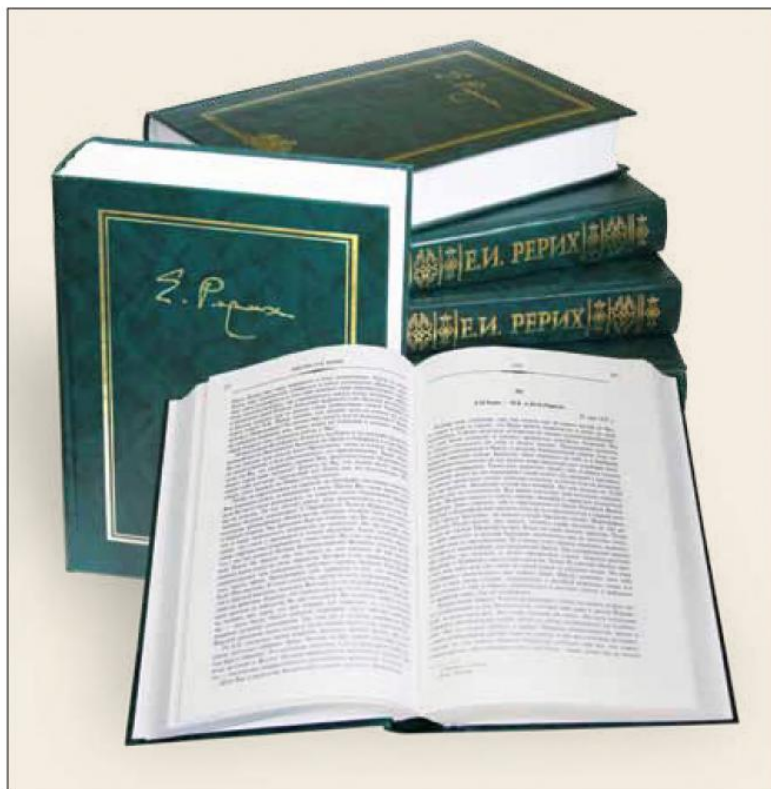
Издание писем Е.И. Рерих в 9 томах, МЦР

люции и прекрасное знание космических законов не помешало их сознательному игнорированию и введению в заблуждение других, да еще в планетарном масштабе. Основным виновником чудовищного духовно-энергетического кризиса, постигшего нашу планету и ее обитателей, Елена Ивановна называет Люцифера. Именно его преступные действия привели к тому, что жизненные устройства человечества пошли вразрез с Космосом и способствовали закреплению в нас жестокости, безнравственности и прочих отрицательных качеств. Он не является вымышленным персонажем, аллегорией безнравственности и порока, это реальное метаисторическое лицо, которое действовало в пространстве нашей планеты как на тонких планах, так и принимая на себя физические воплощения.