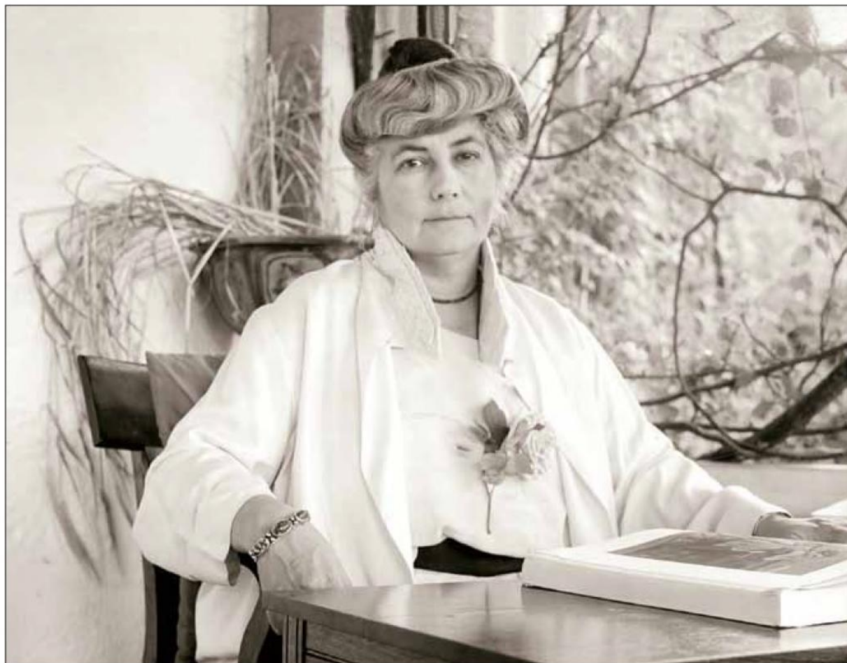
Е.И. Рерих. 1930-е гг.

без объекта, который он поражает: биологический вирус есть набор генетической информации, реализовать которую можно только внутри живой клетки (метаболизм которой после заражения перестраивается на воспроизводство вирусных, а не клеточных компонентов); компьютерный вирус – это программа, которая записывает себя вместо другой информации, используя код других программ, чтобы перехватить управление. 2) Маскировка . Вирус маскируется под безобидное органическое соединение, компьютерный вирус – под полезную утилиту, сообщение программы и т.д. Ментальный вирус, соответственно, маскируется под необходимые механизмы мышления или под функции психики. Информация, содержащаяся в трудах Е.И. Рерих, помогает нам четко представить, что является частью нашего сознания и мышления, а что нет, чему в нем место, а от чего следует избавиться.