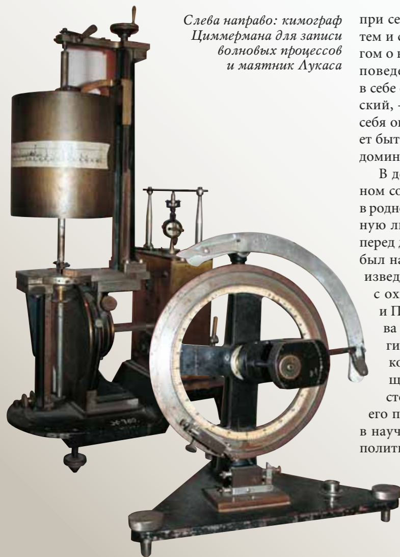
Слева направо: кимограф Циммермана для записи волновых процессов и маятник Лукаса

при себе для трудов и молитвы. «Кто что любит, тем и связан», – подмечает ученый, беседуя с другом о влиянии вещей, быта и обстановки на склад поведения человека. «Если хочешь образовать в себе определенное поведение, – советует Ухтомский, – определенный строй восприятия, свяжи себя определенным бытом <...> Поведение создает быт. Быт определяет поведение: это выражение доминантного цикла» 22 .