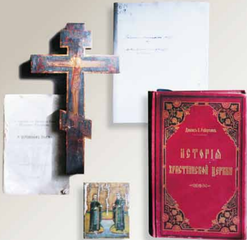
Иконка, на престольный крест и религиозная литература, принадлежавшие А.А. Ухтомскому

рому мы закричали в первые минуты появления на свет; к которому мы плакали не раз, пока росли; к которому плакали в особенности, когда ушли от нас своею дорогою наши дорогие родные; к которому направим мы и последнее свое исповедание в нашем конце» 21 .