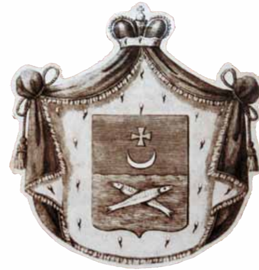
Герб князей Ухтомских

князю Николаю Васильевичу Ухтомскому, деду ученого, а также родовое древо, нарисованное Алексеем Алексеевичем на холсте. Князья Ухтомские приняли свою фамилию от Ухтомской волости и реки Ухтолен. Основателем рода был Иван Иванович Карголомский, потомок князей Белозерских (17 колено от Рюрика, через сына Всеволода Долгорукого). От Ивана Ивановича пошли князья Андогские, Сугорские, Волбодские, Кемские и Карголомские. Как свидетельствует «Родовой сборник», составленный в конце XIX века графом Долгоруким, в роду насчитывалось 31 колено Рюриковичей – 394 человека 9 .