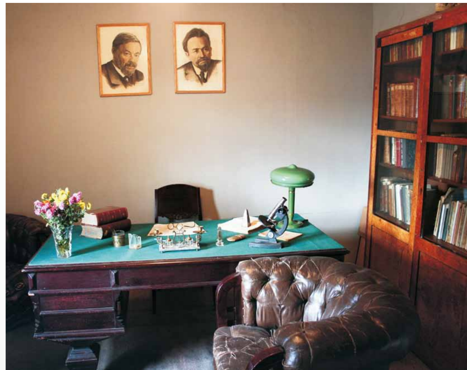
Мемориальный кабинет А.А. Ухтомского. Реконструкция

...Тем летом Ухтомский, подводя итоги своей работы, приступил к научному обоснованию закона доминанты. Его радовало, что рядом с ним – небольшая группа учеников, объединенных общими научными интересами и взаимной любовью. Потом он долго вспоминал их трогательное содружество. В чем секрет подобной удачи, не в том ли, что в университетской Александрии члены ее бодрили, «поднимали друг друга, а потом и самих себя»; умели разглядеть в каждом наиболее ценное – «алтари», а не «задворки»? Куда чаще наблюдается обратное: человек прежде всего замечает в соседе его недостатки, а особенно – те, что чувствует за самим собой! Для чистой души и прочие люди чисты, а потому, размышлял Ухтомский, «чистая юность умеет идеализировать» и так спо-