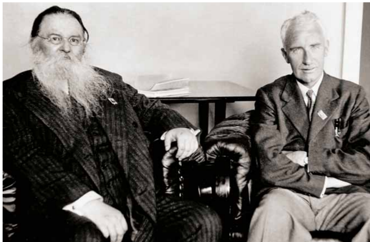
С нобелевским лауреатом Арчибалдом Хиллом