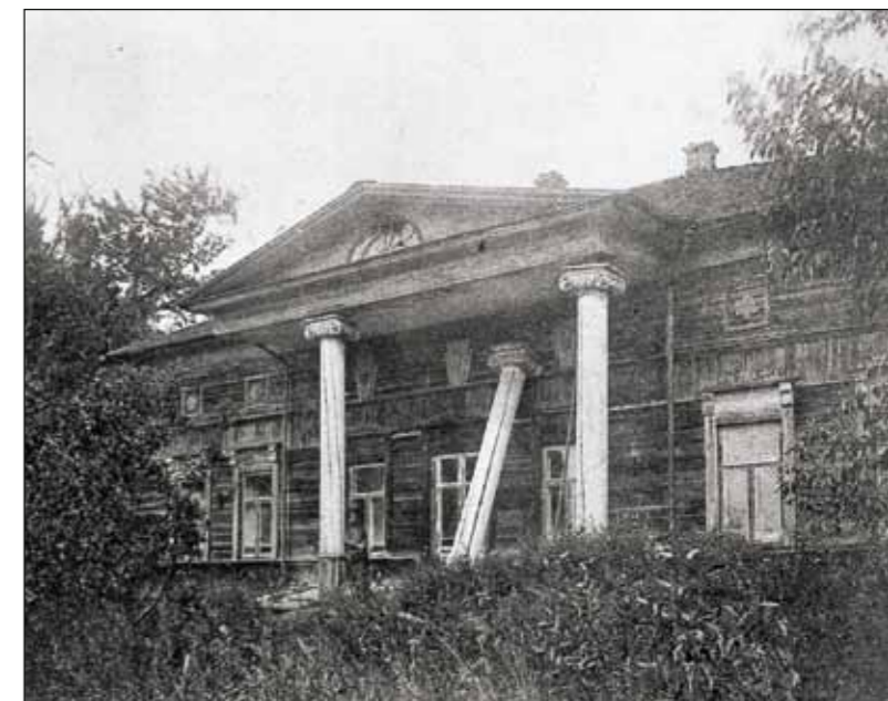
Дом князей Ухтомских в усадьбе «Вослома». 1911

Поиски единомышленников привели Любовь Романовну в Ленинград, в институт имени Ухтомского, помогли наладить контакт с энтузиастом возрождения исторического Рыбинска Л.М. Марасиновой. Когда производственное объединение «Полиграфмаш» выделило необходимые средства, «всем миром» приступили к реставрации. Мемориальный дом-музей академика А.А. Ухтомского был открыт 20 сентября 1990 года и сразу стал одним из наиболее популярных и востребованных научно-культурных центров города.