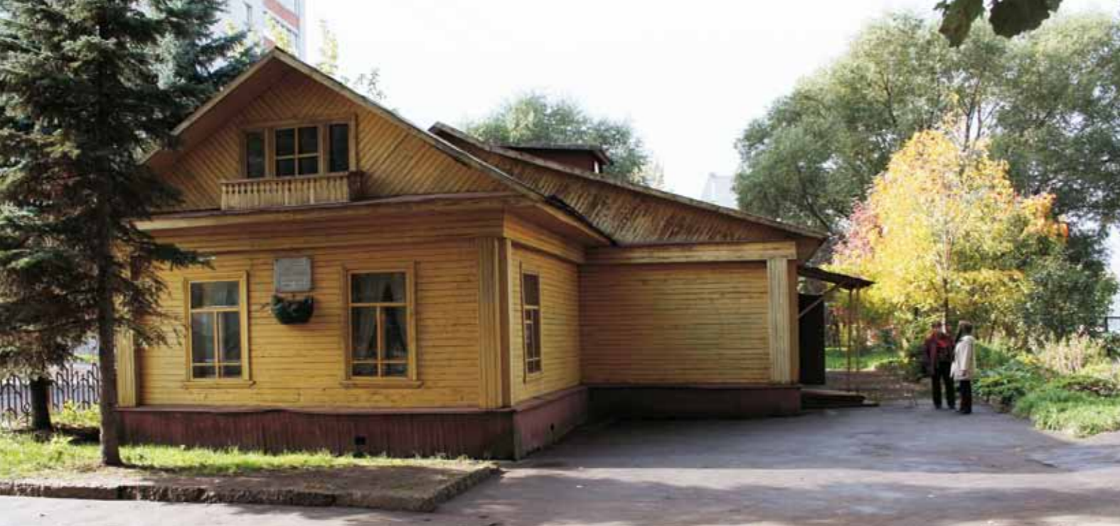
Мемориальный дом-музей академика А.А. Ухтомского. 2010

ву богатое и разностороннее наследие академика А.А. Ухтомского.