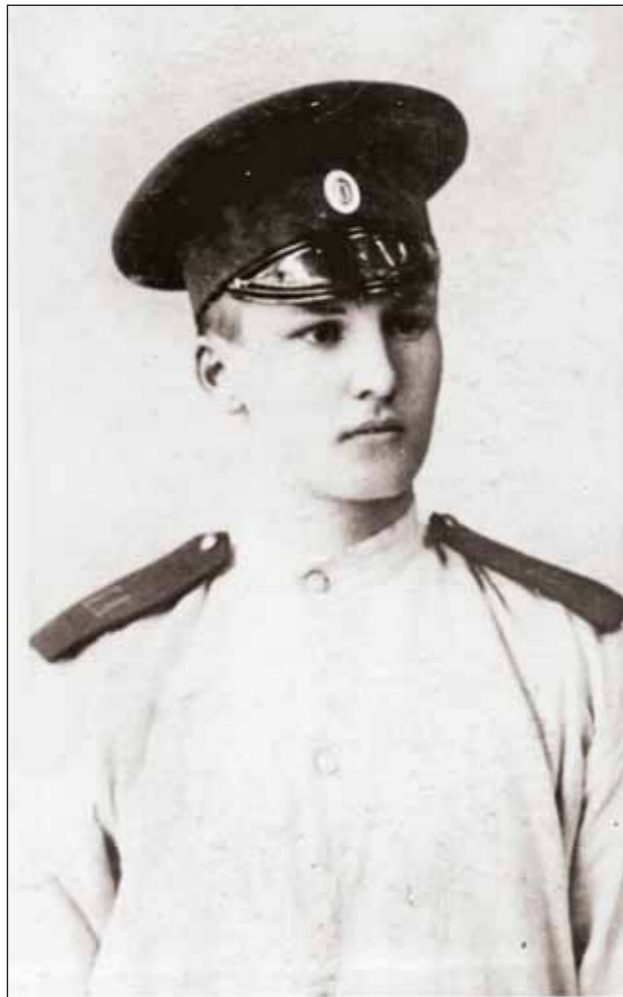
Кадет Алексей Ухтомский