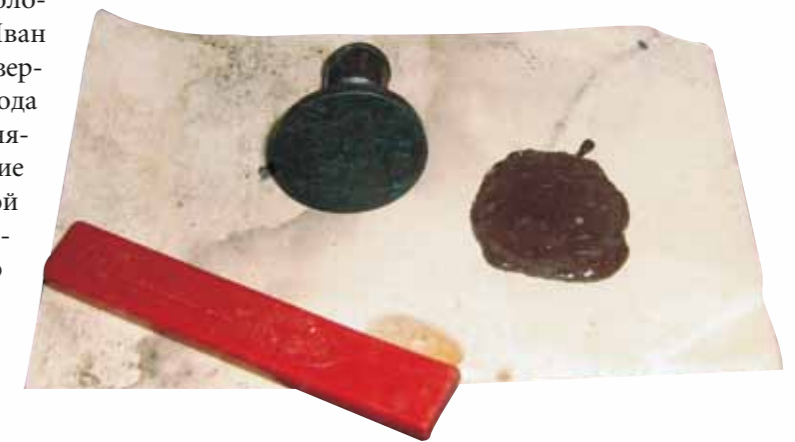
Родовая печать и оттиск князей Ухтомских

Продолжая семейную традицию, юный князь в 1888 году поступает в Нижегородский кадетский корпус имени графа Аракчеева. «Помню, как я обрадовался при виде пушек, которые тогда стояли перед фасадом корпуса, – вспоминал Ухтомский. – Кадеты, офицеры, учителя, барабаны, минский парк, Волга и горы, и крепость... все это навсегда врезалось в мою память» 11 .