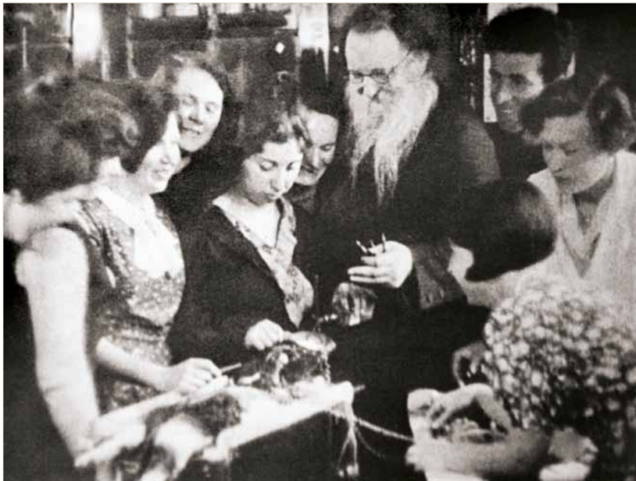
Практические занятия ведет академик А.А. Ухтомский