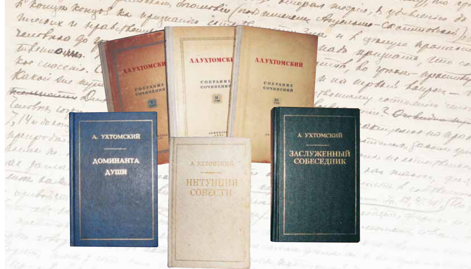
Три тома собрания сочинений (1950–1960-е гг.) и современные издания книг А.А. Ухтомского