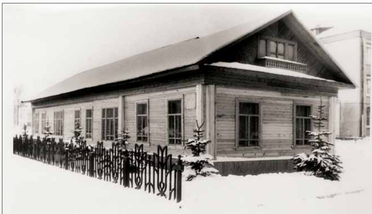
Дом князей Ухтомских в Рыбинске – Мемориальный дом-музей А.А. Ухтомского. 1990