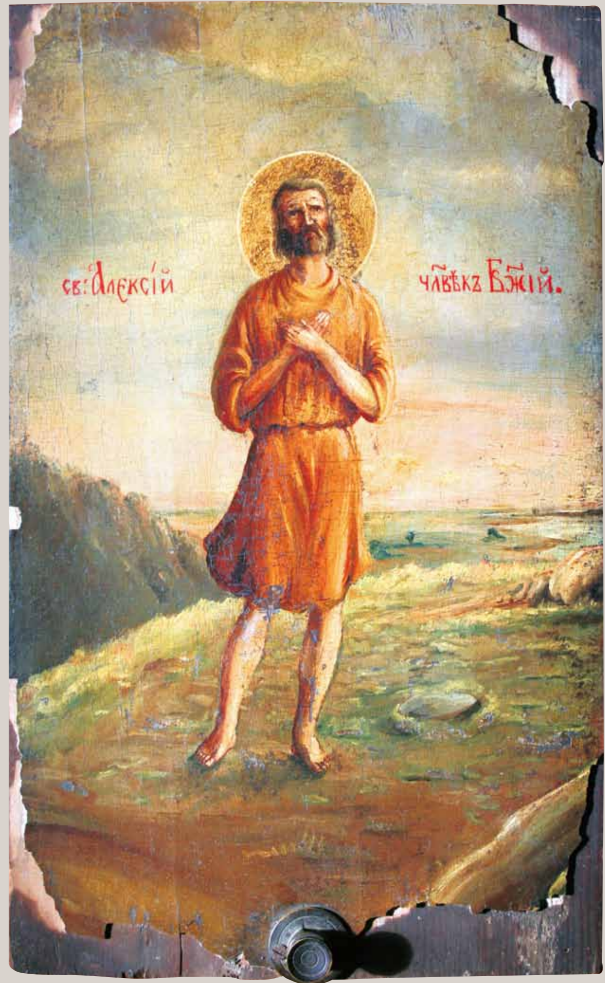
Икона «Св. Алексей – человек Божий» работы А.А. Ухтомского ▶

В мучительные, одинокие тридцатые годы Ухтомский вновь остро ощущает глубокую душевную потребность в непрерывном общении с Высшим. Он размышляет о творчестве и молитве как путях, ведущих к постижению богатства жизни и бытия во всей его полноте, «во всем их трогательном и берущем за сердце значении». Искусство, по мнению Ухтомского, – тончайший показатель того, чем живут люди и человеческие общества. Однако тайны нашего разума и духовной жизни становятся доступными «лишь там, где не утрачивается способность входить в собеседование с тем Собеседником нашим, к кото-