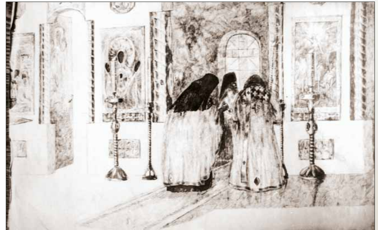
Рисунок Алексея Ухтомского

Он понимал свои цели широко, приступив к изучению «анатомии человеческого духа до религии включительно» и выясняя «возможности религиозного опыта» в плане психологическом,