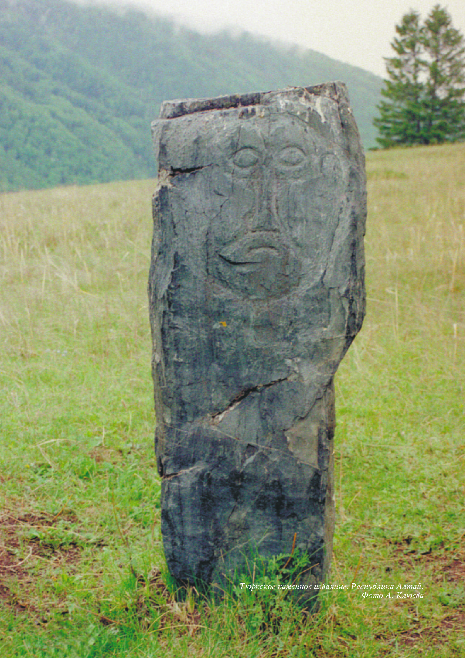
Тюркское каменное изваяние. Республика Алтай.