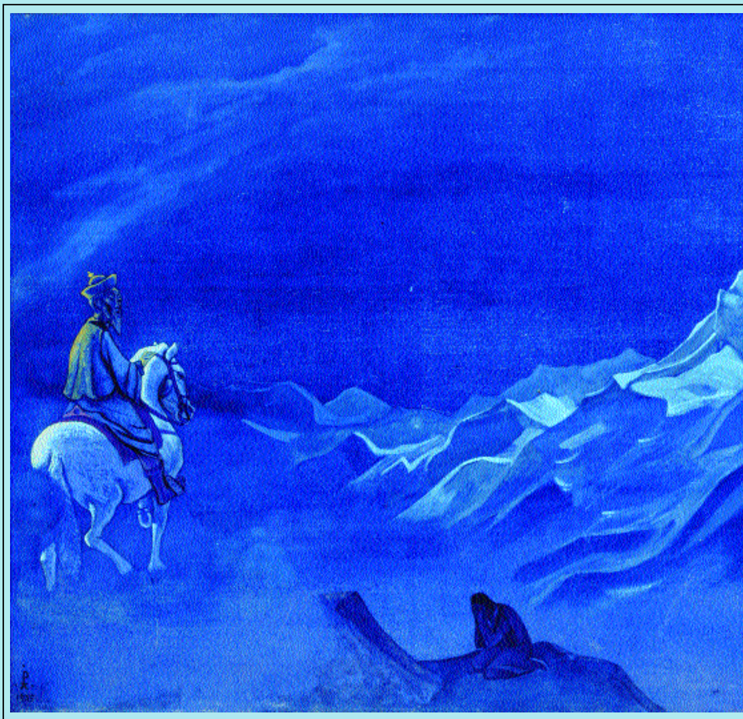
Н.К. Рерих. Ойрот, посланник Белого Бурхана

Ергору. Также было, что женщина беловодская вышла давно уже. Ростом высокая, станом тонкая, лицом темнее, чем наши. Одета в долгую рубаху, как бы сарафан. Сроки на все особые».