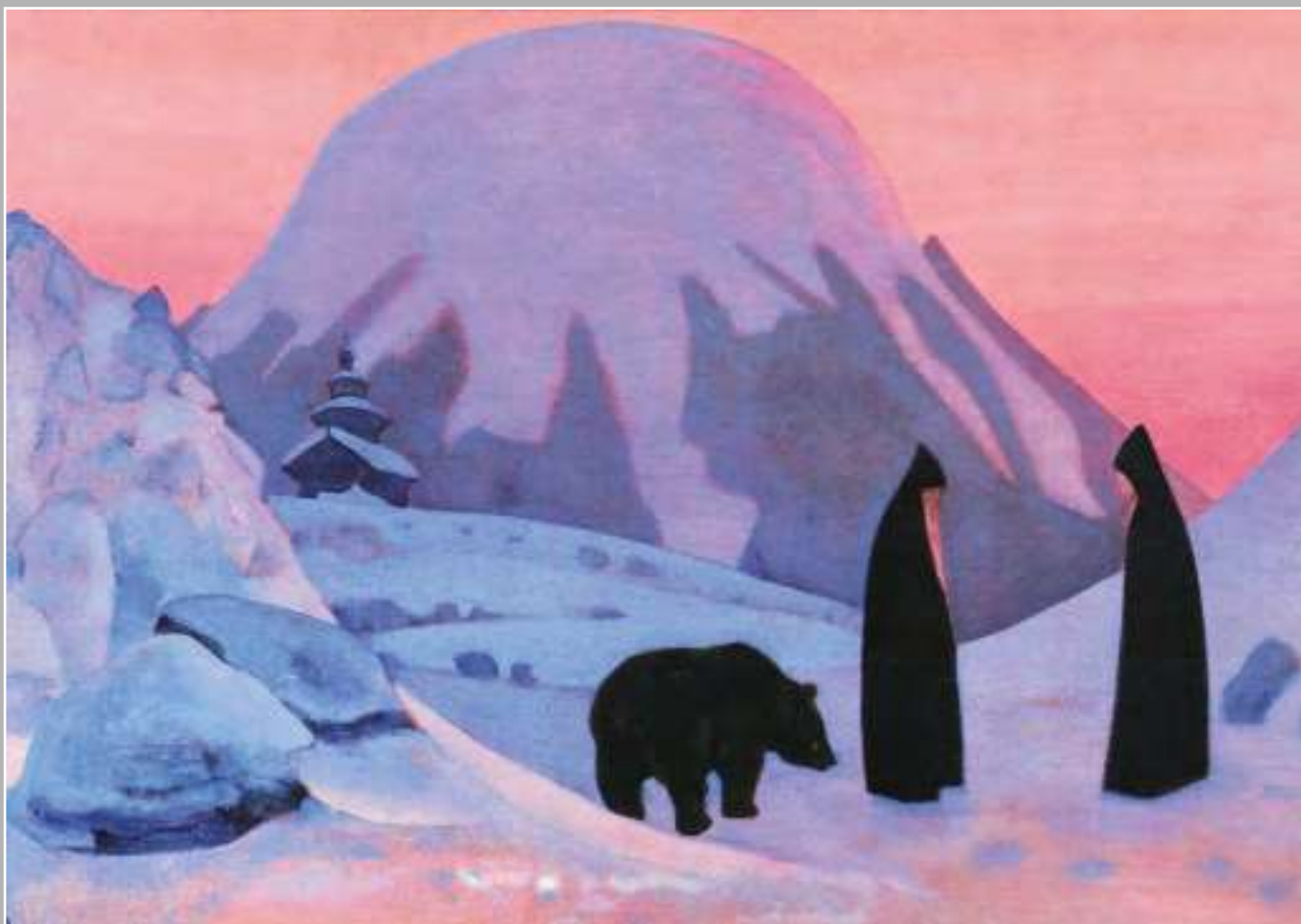
Н.К. Рерих. И Мы не боимся. 1922