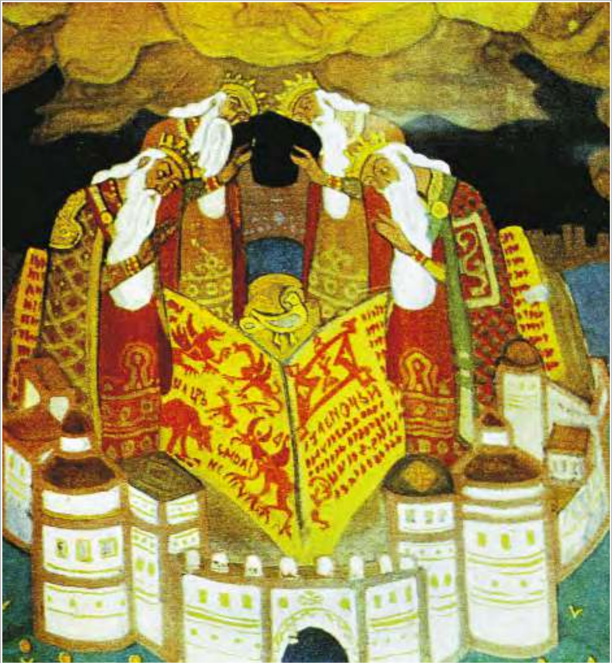
Н.К. Рерих. Голубиная книга. 1911