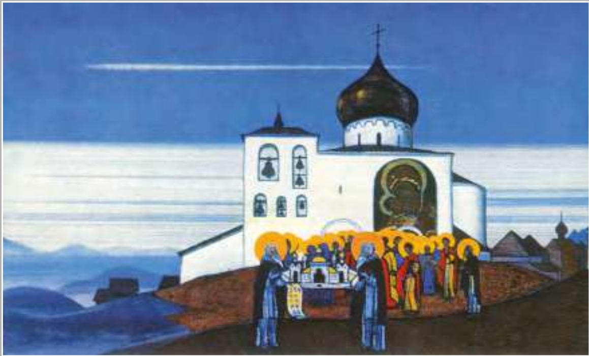
Н.К. Рерих. Звенигород. 1933