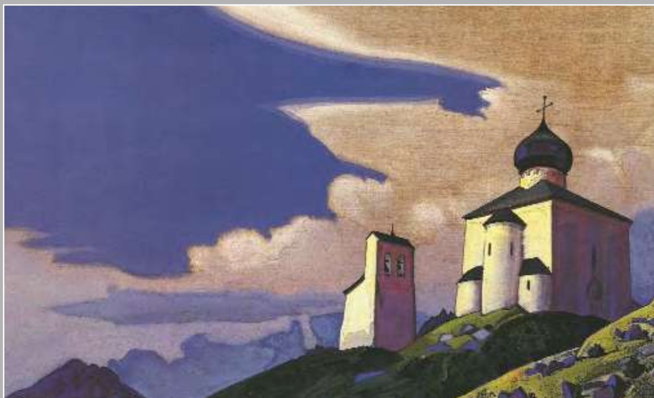
Н.К. Рерих. Сергиева пустынь. 1933