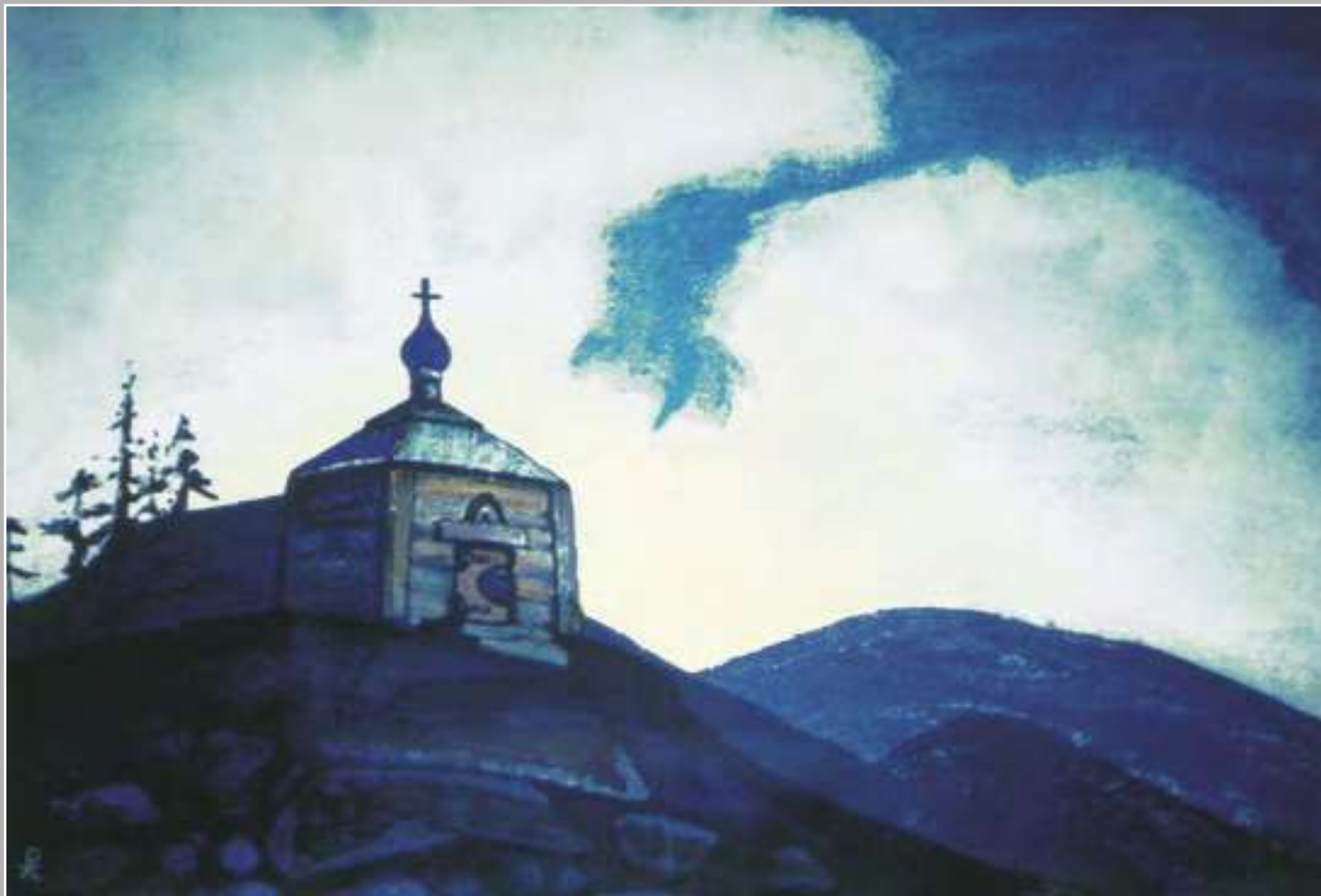
Н.К. Рерих. Часовня Святого Сергия на перепутье. 1931