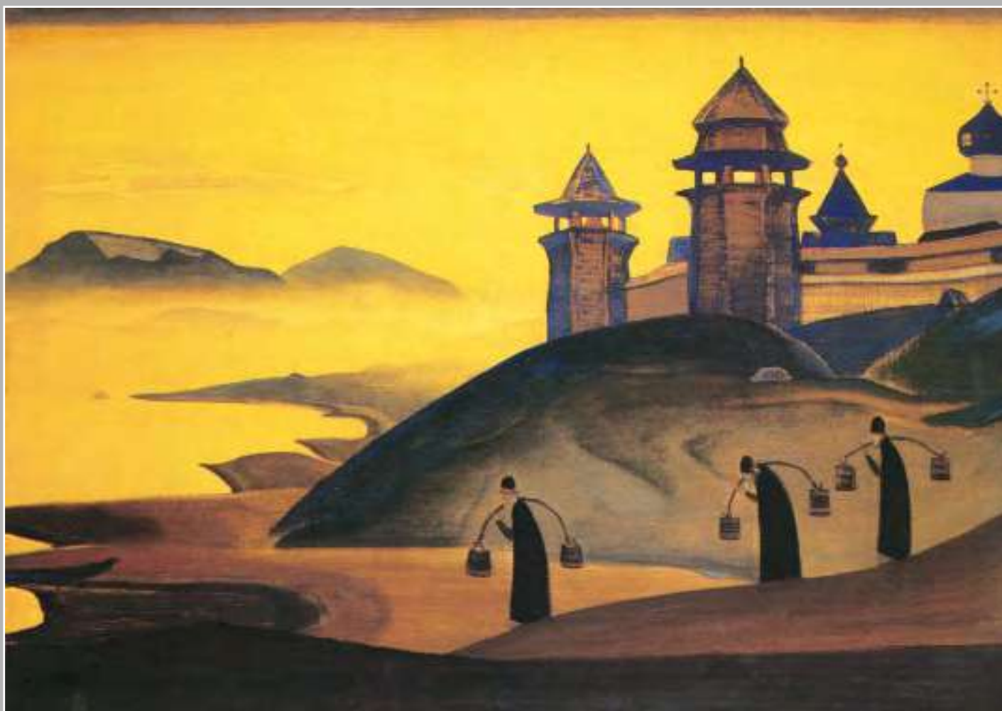
Н.К. Рерих. И Мы трудимся. 1922