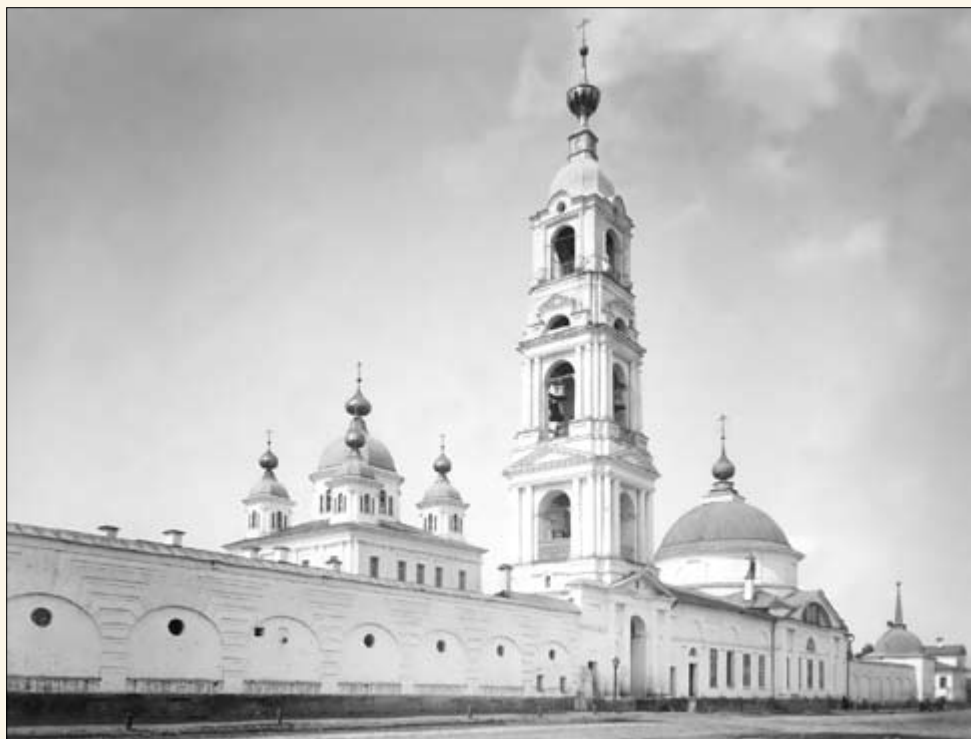
7. Казанский монастырь. Собор и Покровская церковь.