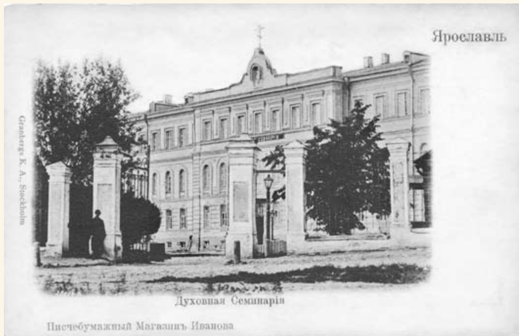
44. Церковь Дмитрия Ростовского при Духовной семинарии