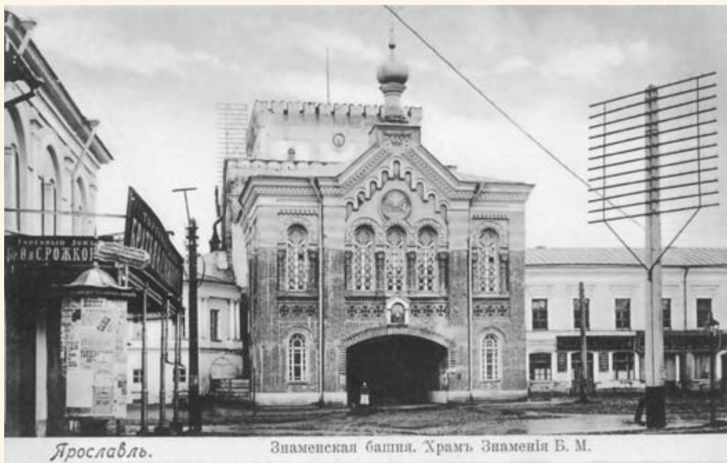
43. Знаменская церковь.