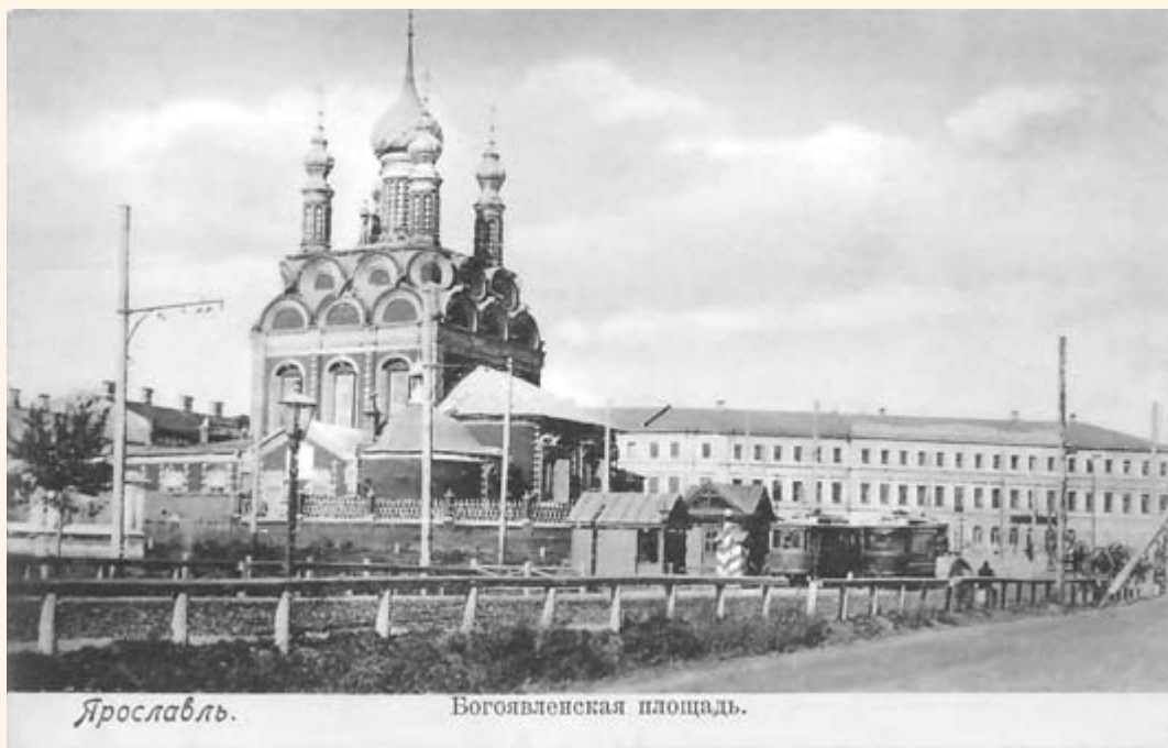
41. Церковь Богоявления.