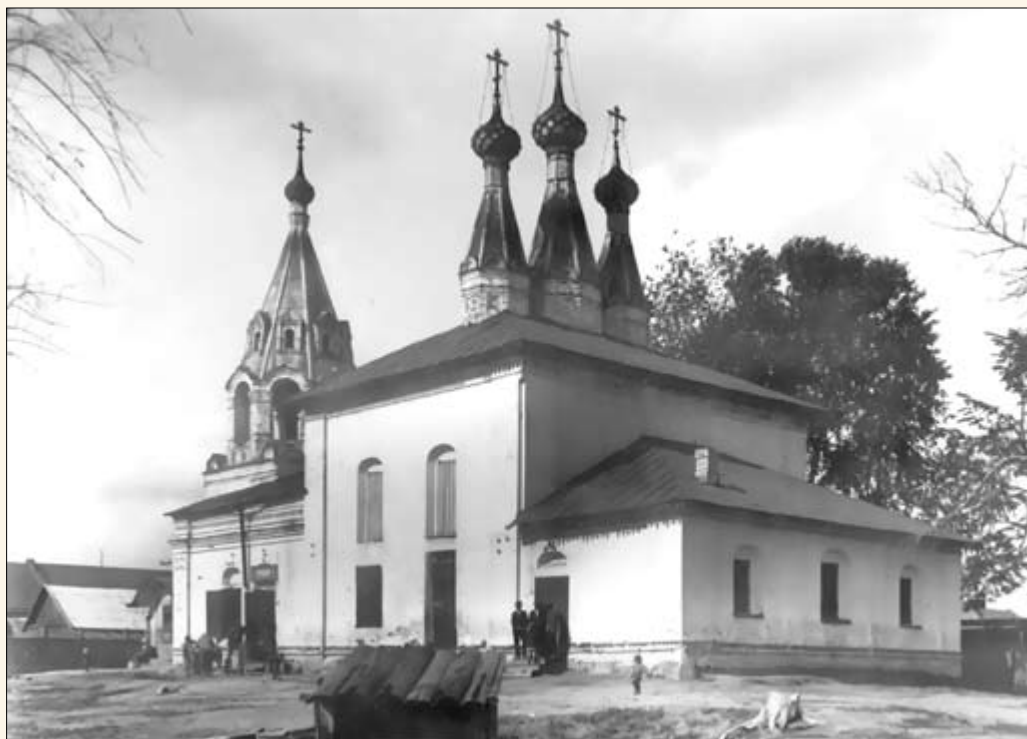
35. Владимирская церковь