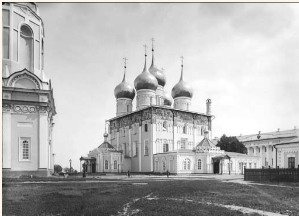
5. Кафедральный Успенский собор