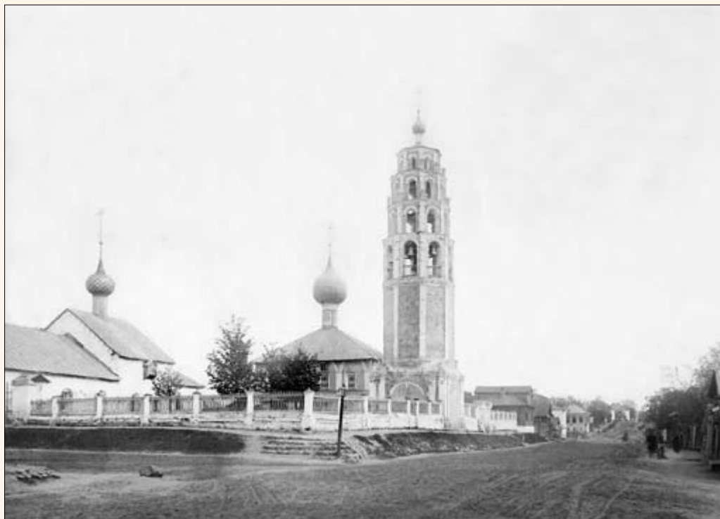
19. Церкви прихода Никиты Мученика.