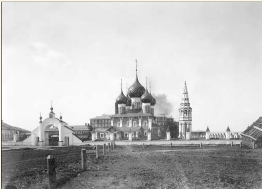
22. Николомельницкая церковь.