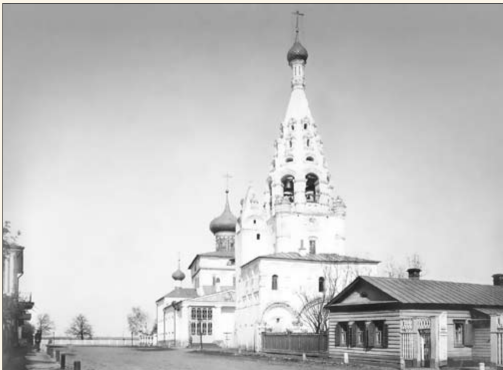
8. Церковь Рождества Христова.