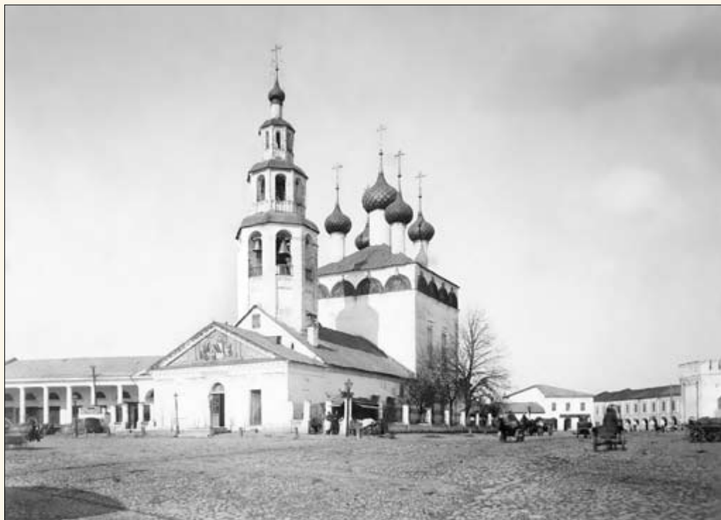
27. Церковь Рождества Богородицы.