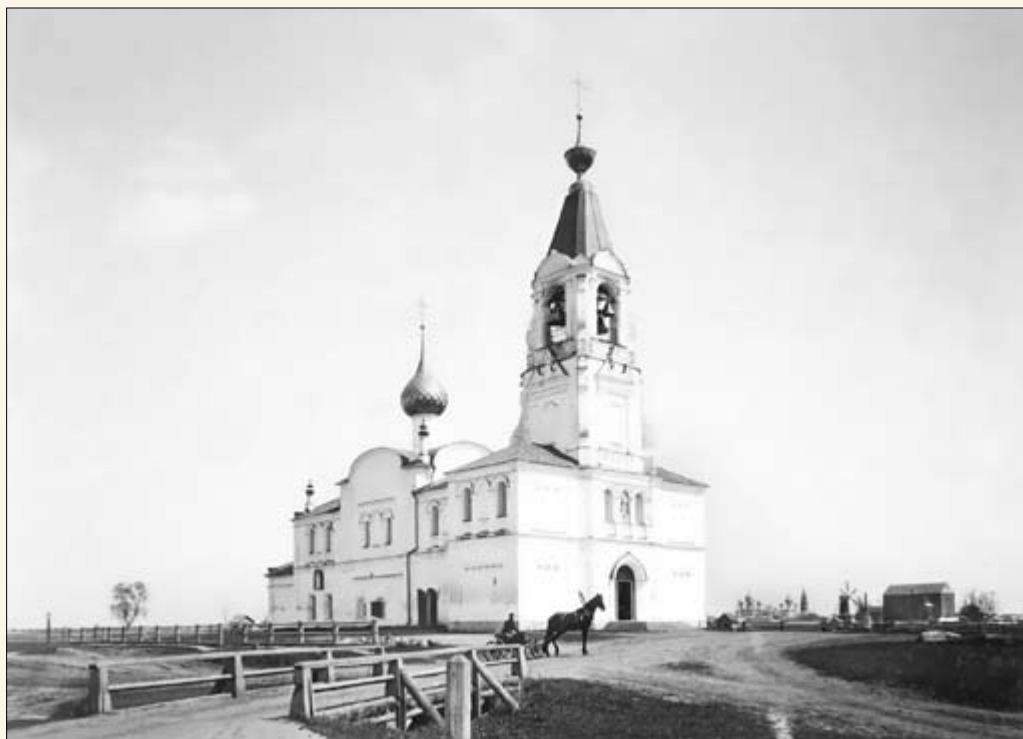
23. Церковь Николая в Тропинской слободе.