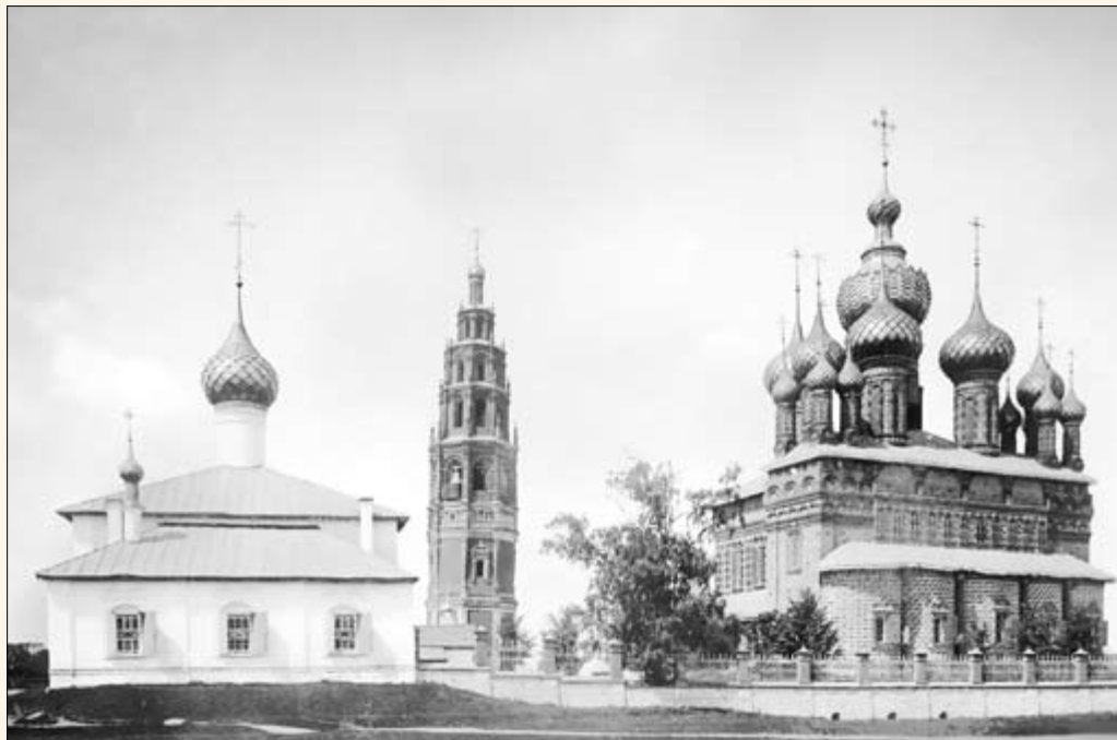
11. Церкви Предтеченского прихода