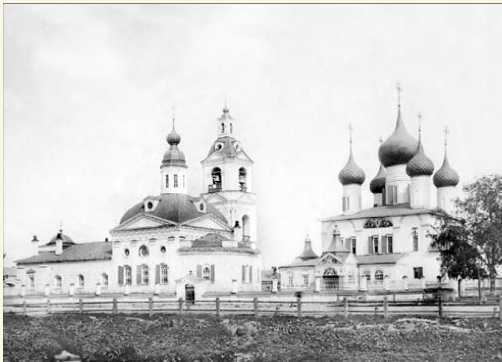
31. Церкви Вознесенского прихода.