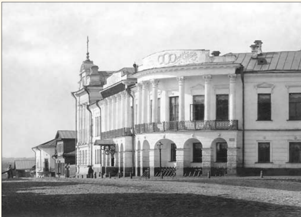
28. Иоанфановское епархиальное женское училище. Покровско-Марьянская церковь