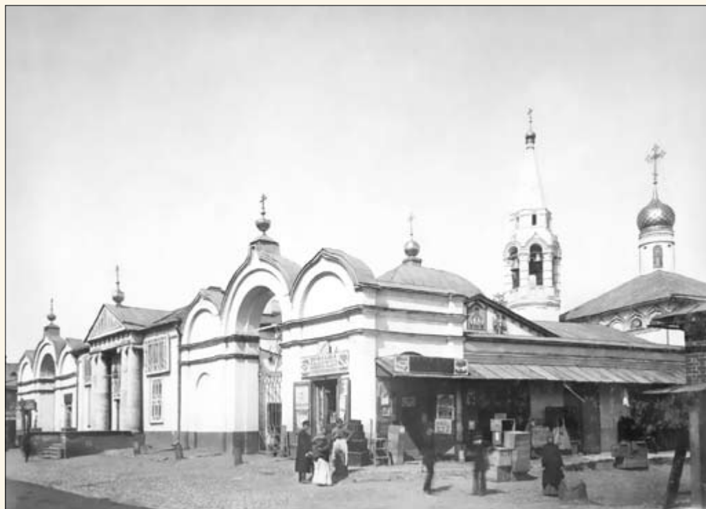
34. Сретенская церковь.