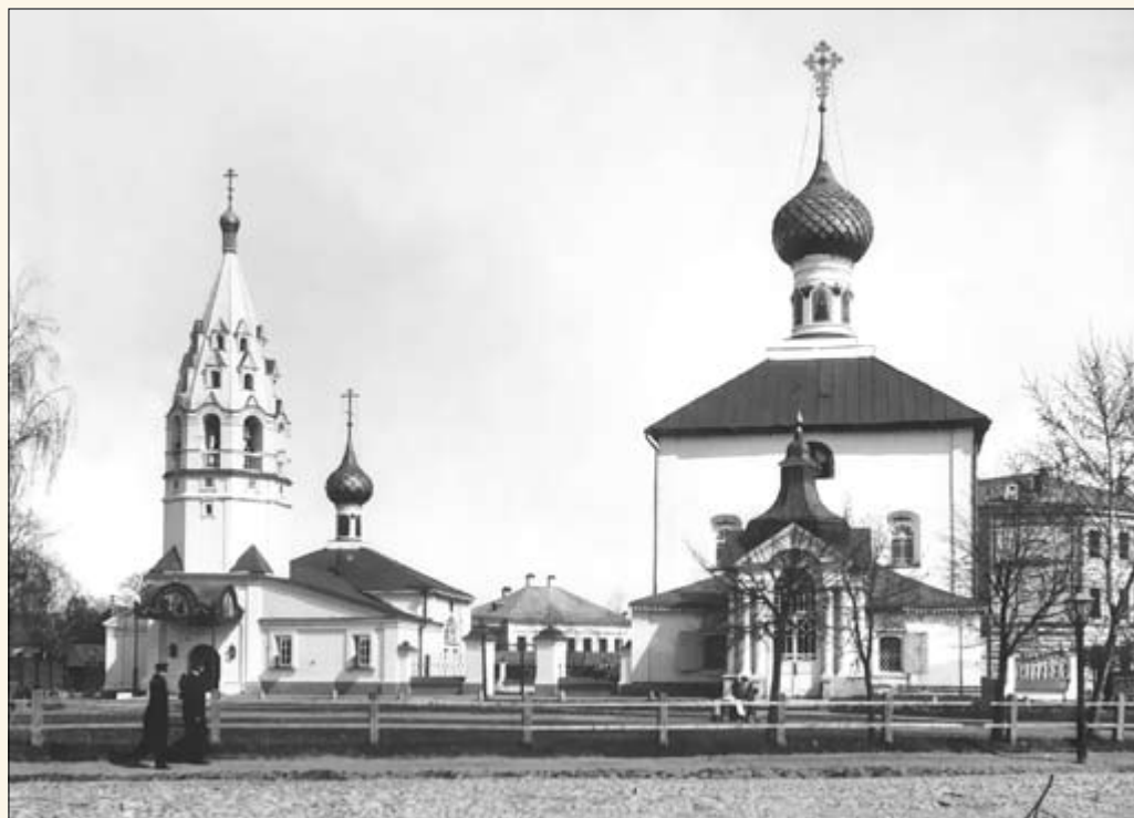
10. Церкви прихода Симеона Столпника.