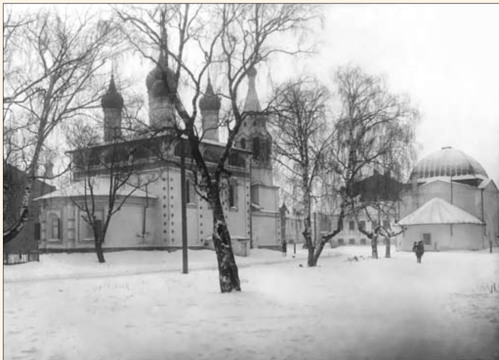
39. Церкви Всехсвятского прихода