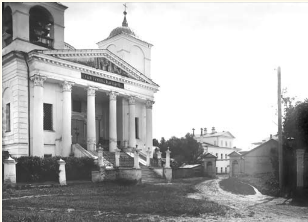
29. Ильинско-Тихоновская церковь. Фото И. А. Лазарева (?)