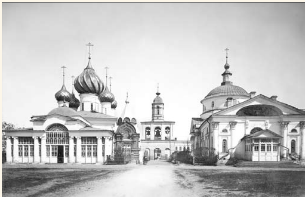
12. Церкви Власьевского прихода.