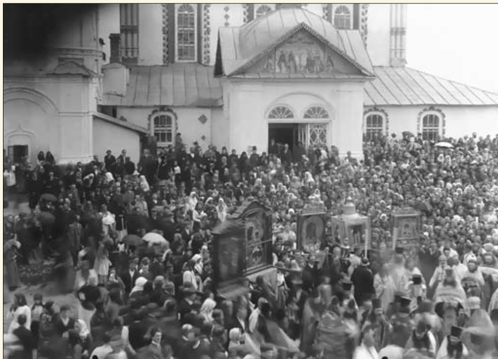
13. Крестный ход у церкви Петра и Павла на Волге.