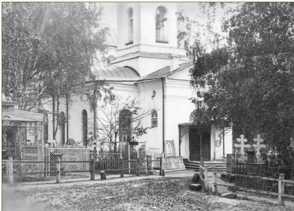
17. Леонтьевское кладбище. Вход в храм