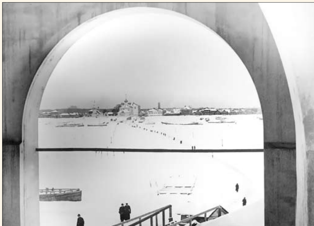
40. Вид на Тверицы через арку Семеновского моста