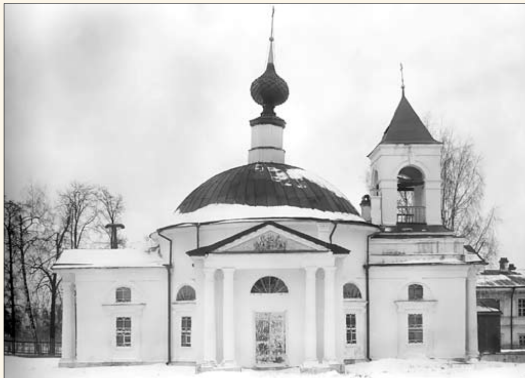
36. Церковь Александра Невского что при городской больнице.