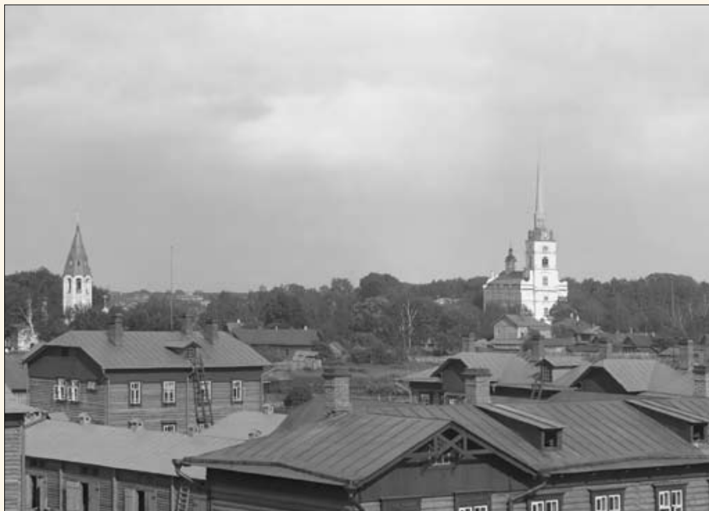
25. За рекой Которослью. Церкви Донская (слева) и Петра и Павла при мануфактуре.