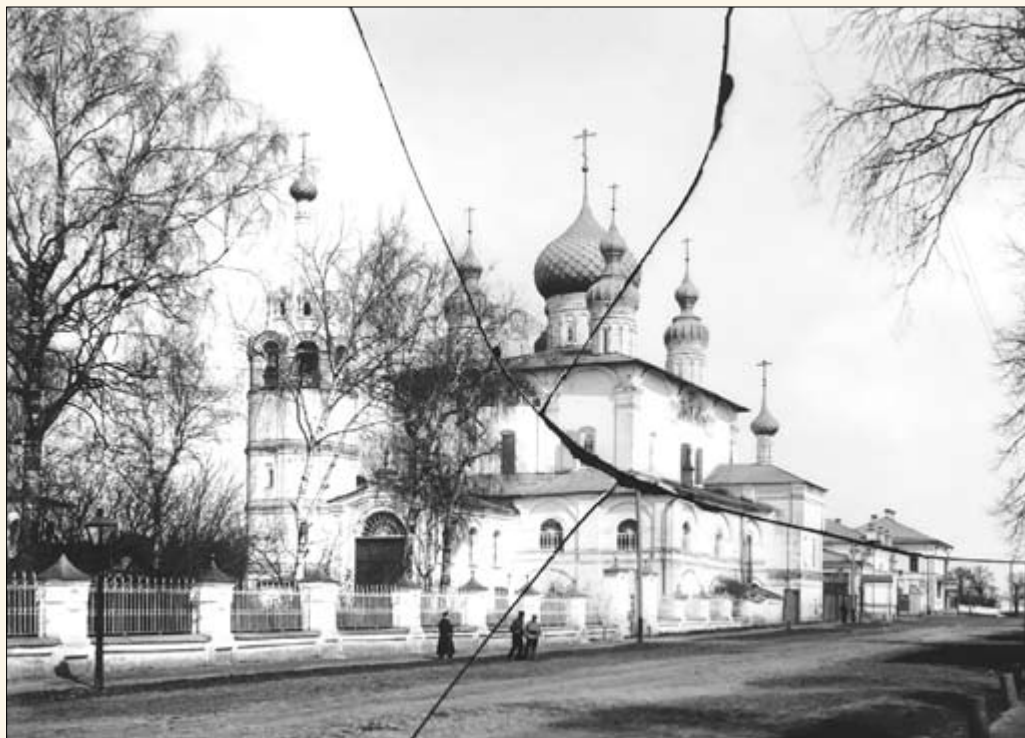
9. Варваринская церковь