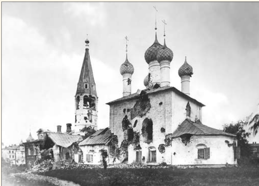
16. Церковь Николы в Рубленом городе. 1918 г.