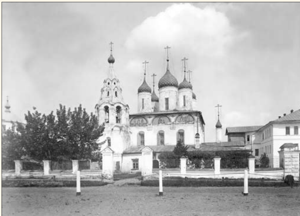
32. Златоустовская церковь у Собора.