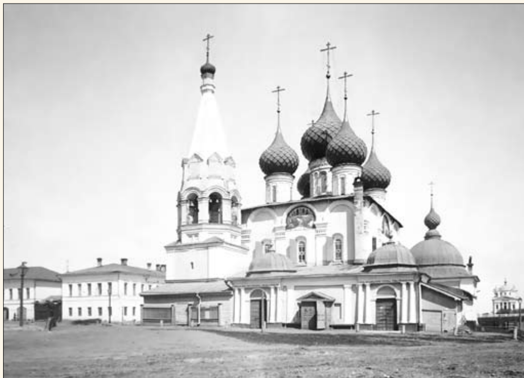
33. Церковь Спаса на Городу.