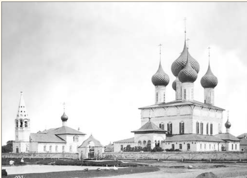
15. Церкви Николы на Пенье и Федоровской иконы Богоматери.