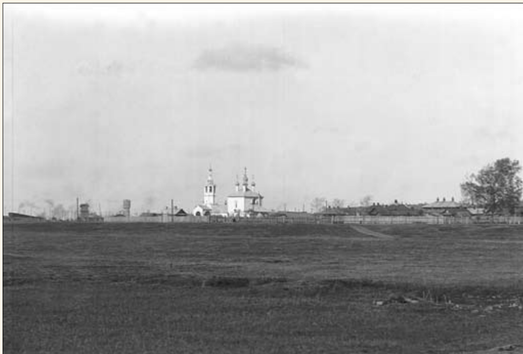
3. Вспольинское поле. Окраина города. Церковь Параскевы Пятницы.