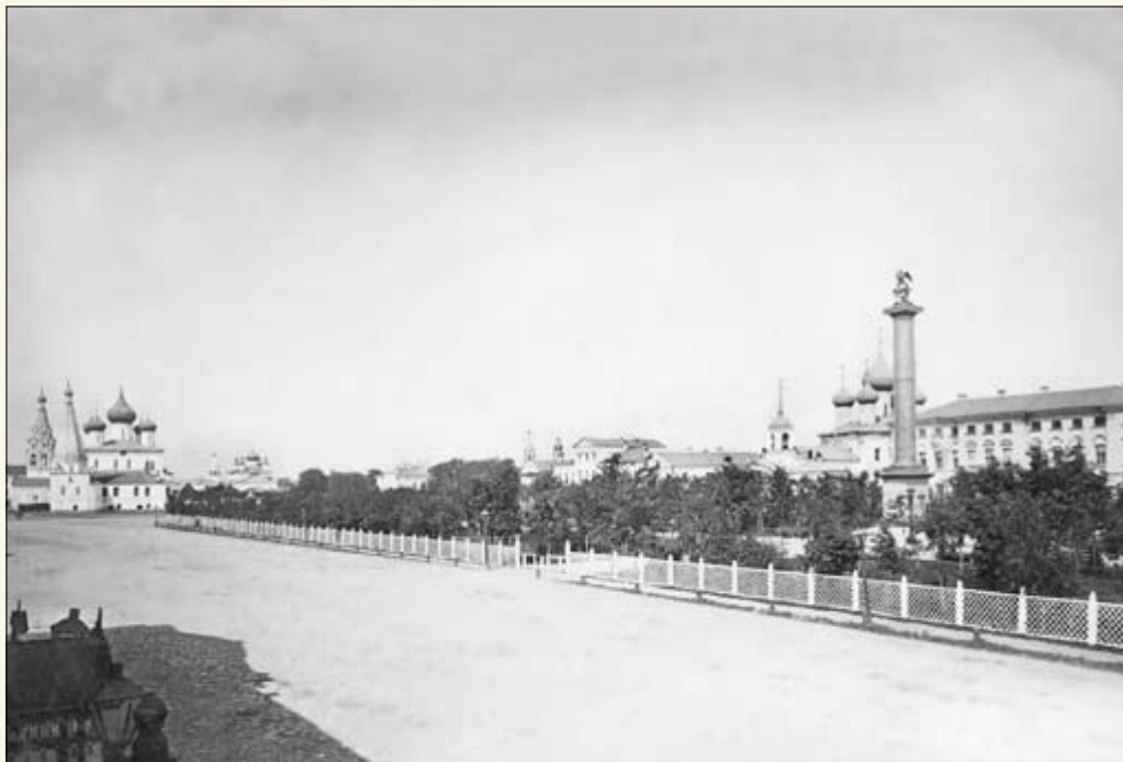
4. Ильинская пл. Центр города. Церкви Ильи Пророка (слева) и Космы и Дамиана.