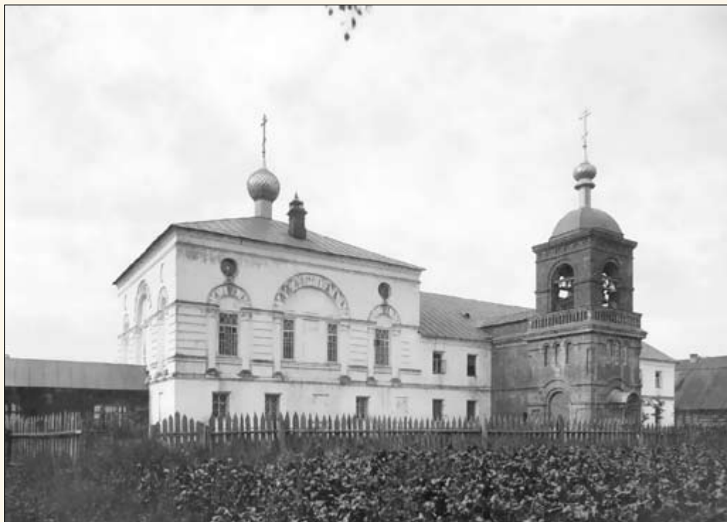
21. Андроновская старообрядческая молельня