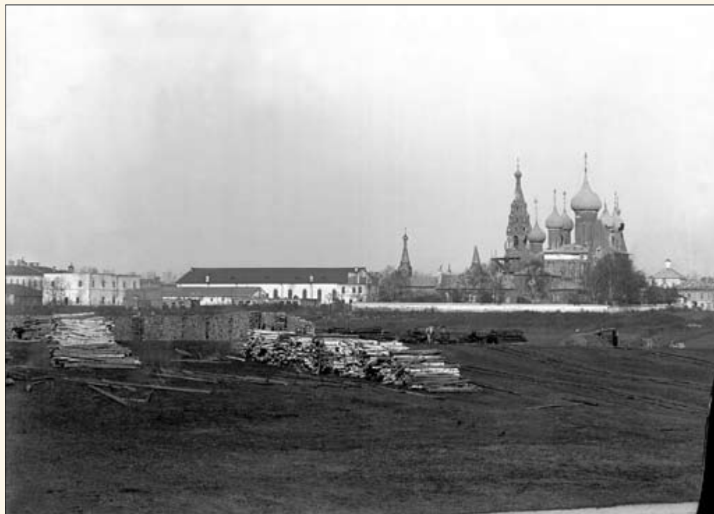
26. Вид на церковь Николая Мокрого.