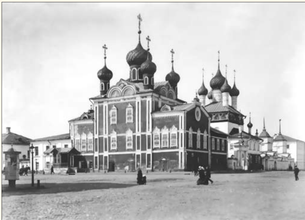
6. Воскресенская и Спасопробоинская церкви, башни Афанасьевского монастыря