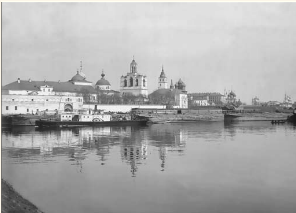
2. Вид на Спасо-Преображенский монастырь.