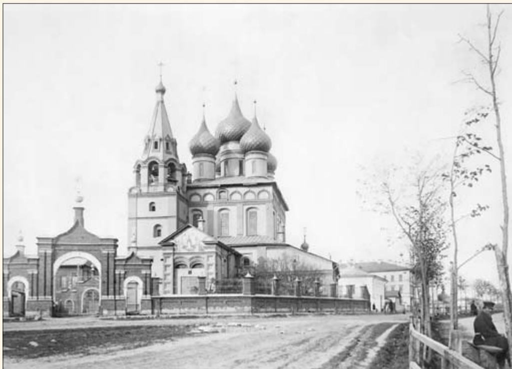
38. Церковь Михаила Архангела.