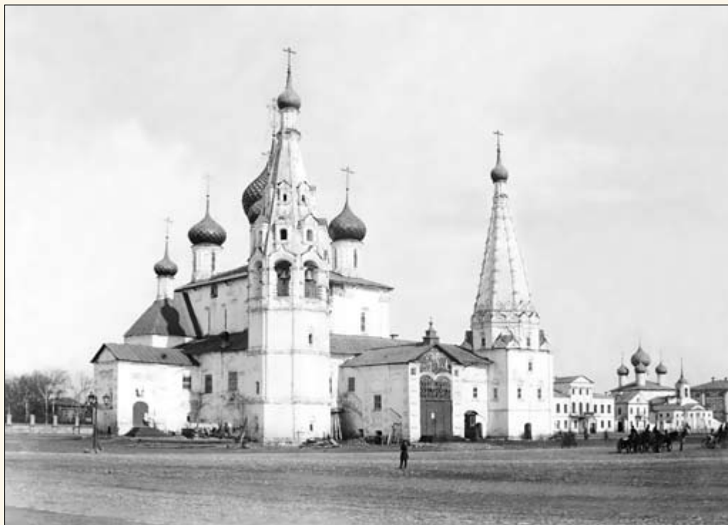
37. Церковь Ильи Пророка. Справа — церковь Космы и Дамиана.