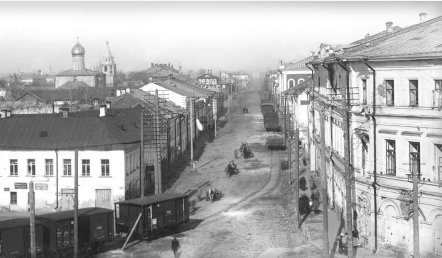
1. Вид с колокольни церкви Рождества Богородицы. В центре видна церковь Дмитрия Солунского, слева — Петра Митрополита.