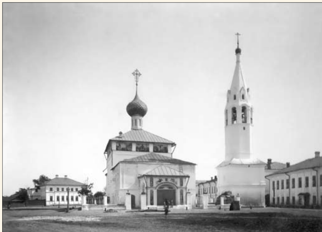
20. Церковь Иоанна Богослова.