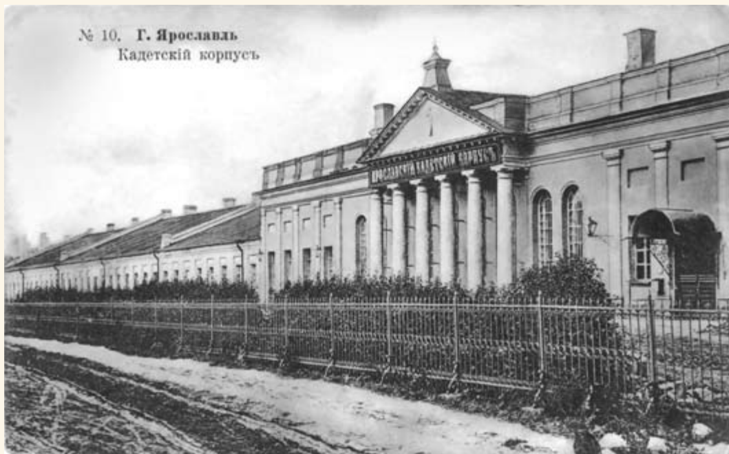
42. Церковь Петра и Павла при Кадетском корпусе