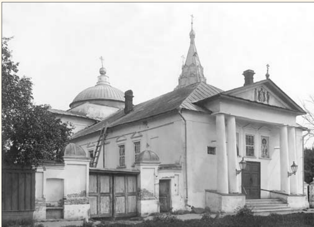
30. Рождественская церковь Николонадеинского прихода.