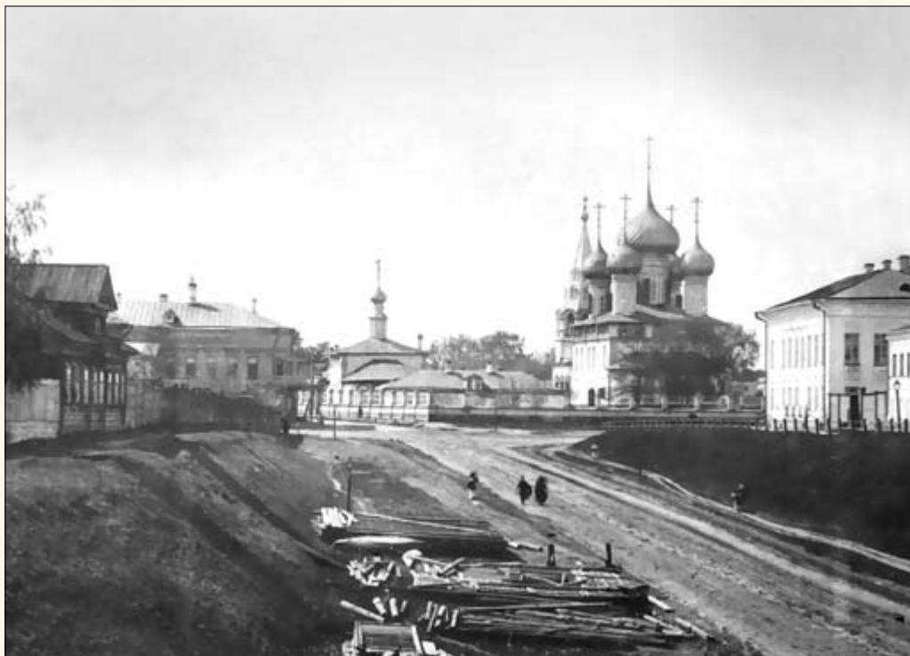
14. Церкви Крестовоздвиженского прихода. Вид с берега Волги