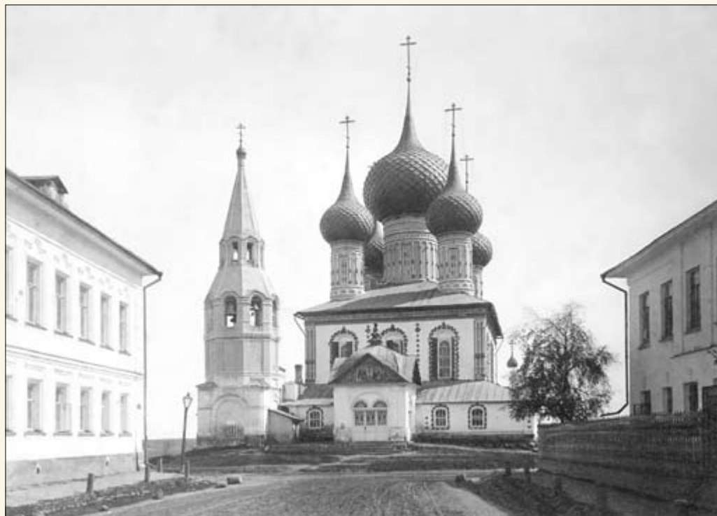
18. Церковь Петра и Павла на Волжском берегу.