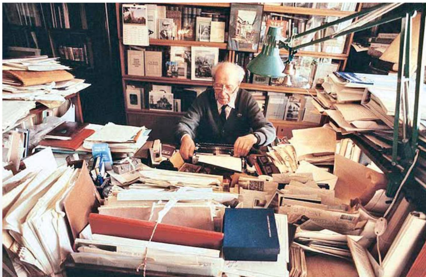
Д.С. Лихачев в рабочем кабинете

и Красоты, способность сердца любить Культуру, защищать ее достижения и трудиться во имя ее на общее благо. Без этого невозможно распознать лучшие, спасительные пути преобразования жизни.