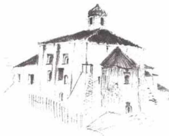
Петр и Павел на Славне

Ясно, что у наших многочисленных министерств культуры свои проблемы. Поэтому необходима общественная мобилизация всех культурных сил нашей страны, объединение интеллигенции, создание по всей стране кружков, клубов, общественных организаций коллекцио-