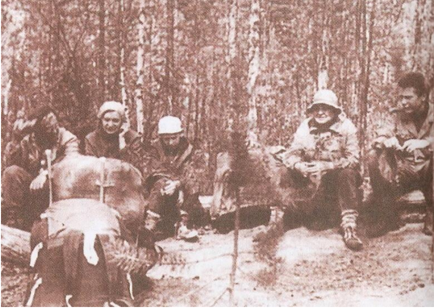
Привал у Куликовской лестницы