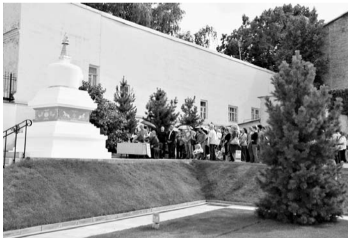
Церемония благословения Ступы Трех Драгоценностей

Далай-лама широко известен в современном мире как философ, мыслитель,