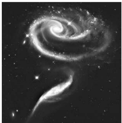
Это фотография пары взаимодействующих галактик под названием Агр 273 была выпущена в ознаменование 21-й годовщины запуска НАСА / ESA космического телескопа Хаббла. Искаженная форма большей из двух галактик показывает признаки приливных взаимодействий с меньшей.