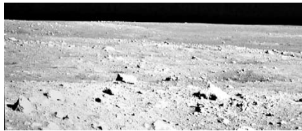
После прилунения, первый китайский луноход «Юйту» («Нефритовый заяц») начал передавать фотоснимки Луны, первый из этих фотоснимков Вы можете видеть выше.

Следовало бы снять фильму с Луны после ее полнолуния, когда она бывает еще видна по утрам. Но снимать следует, когда Солнце следует, когда Солнце уже взошло. Лучи солнца восходящего парализуют ее излучения и ультрафиолетовые лучи и дают возможность снять настоящую Луну. Лучи Луны еще никем не изучаются, но эти лучи страстно сильно действуют на нашу