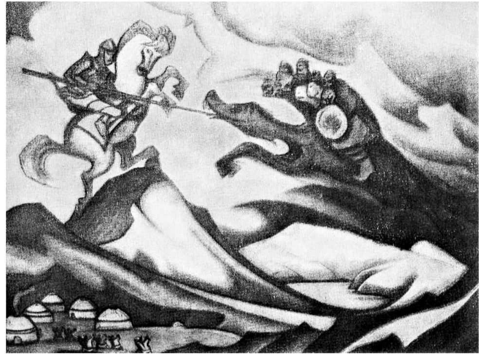
Н.К. Рерих. Бум-Эрдени. 1947