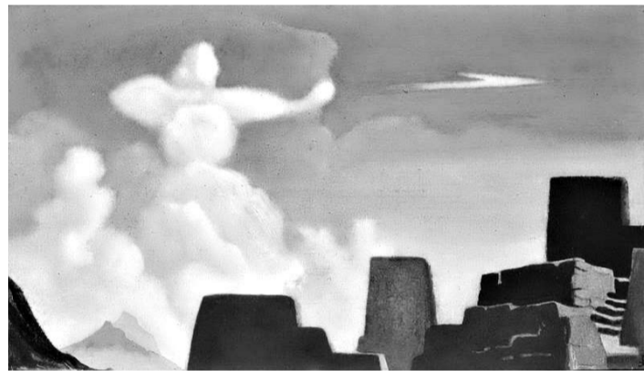
Н.К. Рерих. Защитник. 1937