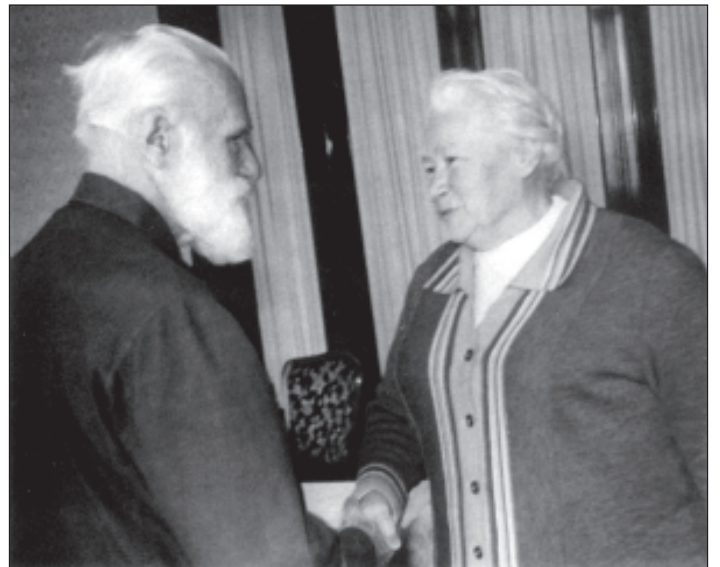
С.Н. Рерих и Л.В. Шапошникова. Москва. 1987 г.

– Наши коллекции, – коротко бросил Святослав Николаевич. Это были коллекции, частично оставшиеся от Центрально-Азиатской экспедиции Рериха и собранные экспедициями самого Института, – богатейший научный материал, к которому несколько десятков лет не прикасалась рука ученого. В застекленных шкафах и ящиках находилось собрание ценных этнографических и археологических находок. Орнитологическая коллекция насчитывала около 400 видов редчайших птиц, некоторые из них сейчас уже исчезли. Ботаническая – полностью представляла флору долины Кулу. Геологическая – содержала немало редких минералов. Тут же были и зоологическая, фармакологическая, палеонтологическая коллекции.