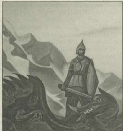
Н.К. Рерих. Победа. Фрагмент. 1942 г.