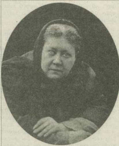
Елена Петровна Блаватская. Фото 1888 – 1889 гг.

«Есть путь, нелегкий и тернистый, изобилующий всевозможными опасностями, но все же существующий, и ведущий к самому сердцу Вселенной. Я могу рассказать, как найти тех, кто укажет вам тайные врата, открывающиеся только внутрь, но тут же и навсегда захлопывающиеся за неофитом, ступившим за них. Нет опасности, не преодолимой бесстрашной отвагой; нет испытания, которое не могла бы пройти безупречная чистота; нет трудности, с коей не справился бы сильный разум. Тех, кто побеждает, ждет впереди награда, которую не описать никакими словами, – власть благословить и спасти человечество; для тех, кто проиграл, впереди – множество жизней, в которых еще может прийти успех».