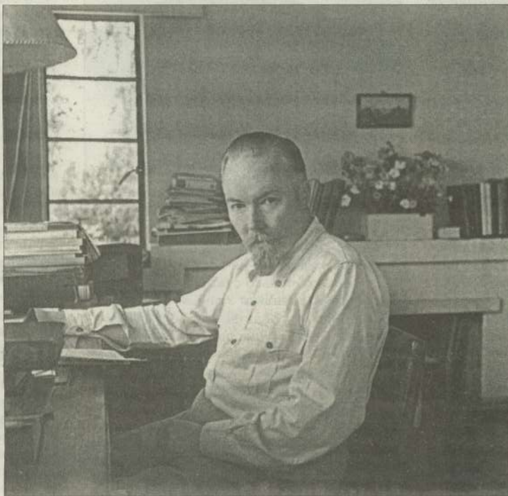
Юрий Николаевич Рерих в своем рабочем кабинете. Калимпонг, 1950-е гг.

них просторов на состояние духа человека сказал Н.К. Рерих: «Молодые друзья, вам нужно знать условия караванной жизни в пустынях, только на этих путях вы научитесь бороться со стихиями, где каждый неверный шаг - уже верная смерть. Там вы забудете числа дней и часы, там звезды заблестят вам небесными рунами. Основа всех Учений - бесстрашие. Не в кисло-сладких пригородных лагерях, а на суровых высотах научитесь быстроте мысли и находчивости действий. Не только на лекциях <...>, но на студеных глетчерах осознаете мощь работы материи, и вы поймете, что каждый конец есть только начало чего-то, еще более значительного и прекрасного» [2].