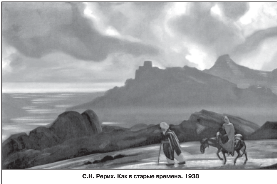
С.Н. Рерих. Как в старые времена. 1938

Еще говорил Учитель: «Уберегитесь от дурных мыслей. Они обратятся на вас и осядут на плечи ваши, как омерзительная проказа. Но добрые мысли вознесутся ввысь и вас вознесут. Нужно знать, насколько человек носит в себе и свет целебный, и мрак смертный». <...>