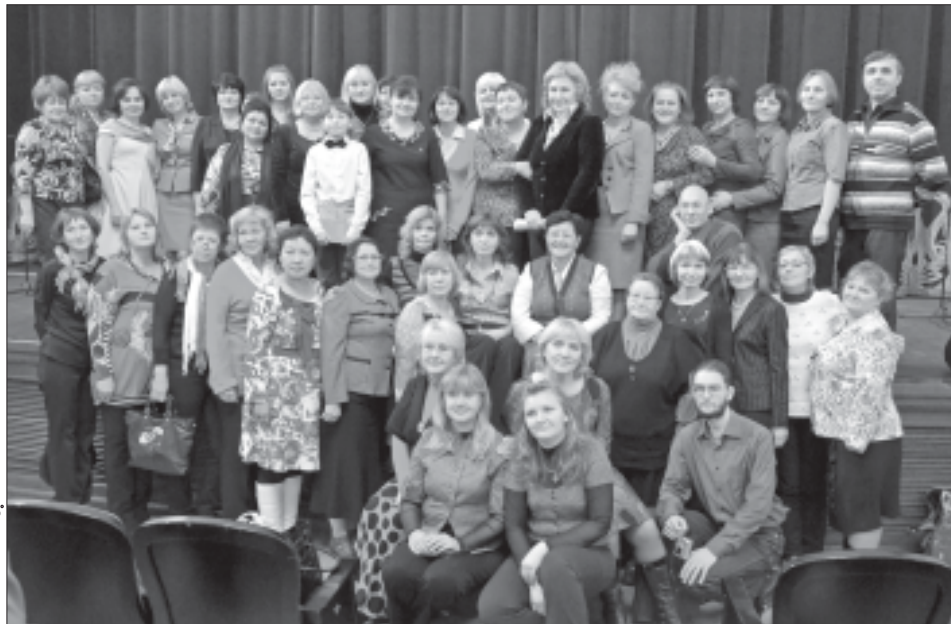
Участники пятых Всероссийских педагогических Чтений в Новокузнецке

Новокузнецку выпала честь и счастье провести у себя 5 - 6 ноября 2012 года V Всероссийские педагогические Чтения, посвященные светлой памяти Валерии Гивиевны Ниорадзе, выдающегося ученого, учителя, которая всю жизнь вместе с Шалвой Александровичем Амонашвили посвятила служению гуманной педагогике. Организатором Чтений выступила Лаборатория гуманной педагогики г. Новокузнецка Кемеровского регионального отделения общероссийской общественной организации «Центр гуманной педагогики». Мы благодарны за поддержку Комитету образования и науки Администрации г. Новокузнецка, Институту повышения квалификации учителей, Кузбасской государственной педагогической академии, Лицею № 111 и Новокузнецкому городскому Совету народных депутатов.