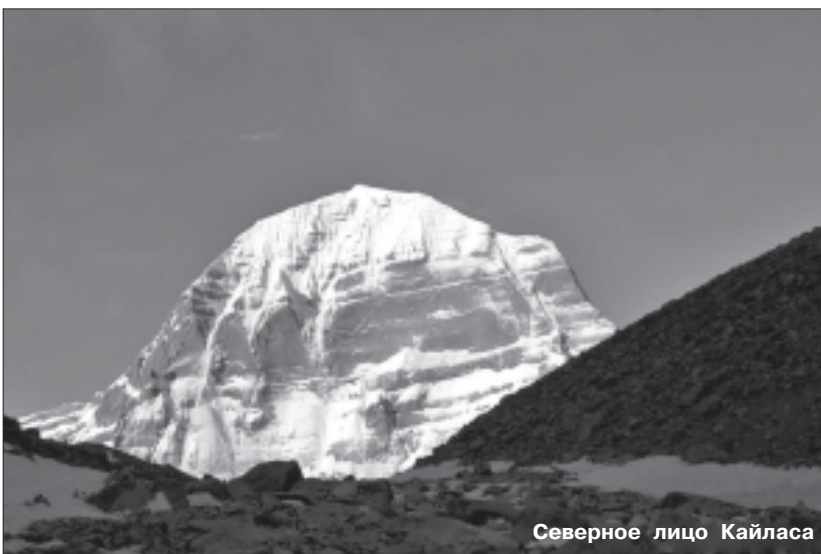
Северное лицо Кайласа

Побывали в пяти из восьми буддийских монастырей, расположенных вокруг озера Манасаровар – Чуи, Сералунг, Труго, Госсул, а также осмотрели руины монастыря Понри, расположенного в горных отрогах хребта