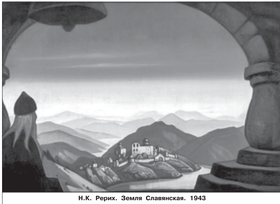
Н.К. Рерих. Земля Славянская. 1943

360. Лучше не трогать огненный провод, когда нет уверенности в чистоте своих мыслей. Вибрации мыслей проводу передают-