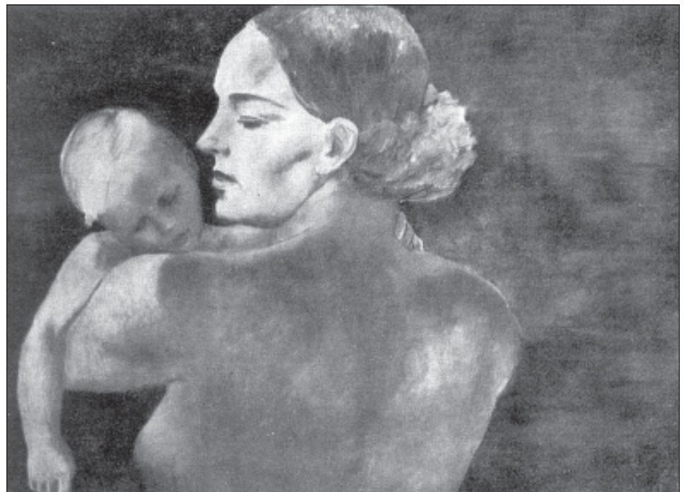
А.А. Дейнека. Мать. 1932

Воспитатель, ваша миссия - утвердить в детском сердце чувство заботы о матери как о самом дорогом в мире. Чтобы даже мысль об утрате матери была ужасной. Чтобы каждое ее слово было святыней, чтобы воля ее стала для детей законом. Это восхождение на вершину нравственности постепенное, но безостановочное. Надо использовать каждое жизненное обстоятельство для того, чтобы ребенок понял, что такое мать. Одного чувства привязанности мало. Ребенок должен как можно раньше задумываться, осмысливать, рассуждать. Чем взрослее будет мысль, тем глубже будут детские чувства. Как