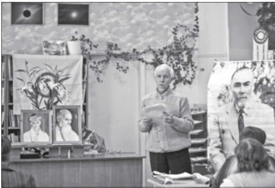
Рериховские чтения в Кемерово, 24 ноября 2012 года

Творчество всех представителей семьи Рерихов составляет огромный материал для изучения. Широко известна Центрально-Азиатская экспедиция Рерихов, которая прохо-