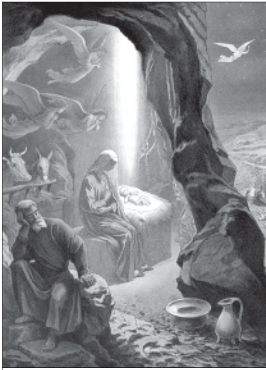
Григорий Гагарин. Рождество Христово

ровой язык, который неминуем в эволюции» [3, 19].